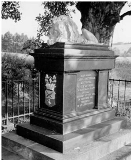
Starý Rokytník, pomník setníka Krušiny, e.č. 55, 2003