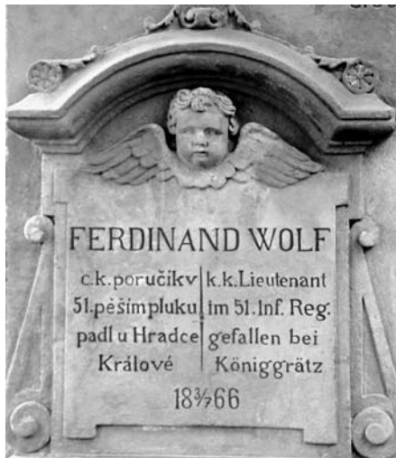
Cerekevce, nápisová deska poručíka Wolfa, e.č. 95, červen 2003