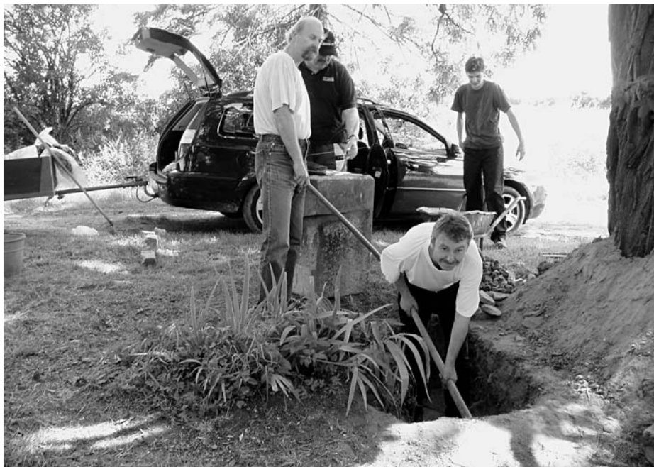
Václavice, pomník 23 padlých, e.č. 79, zhotovení nového základu, srpen 2003