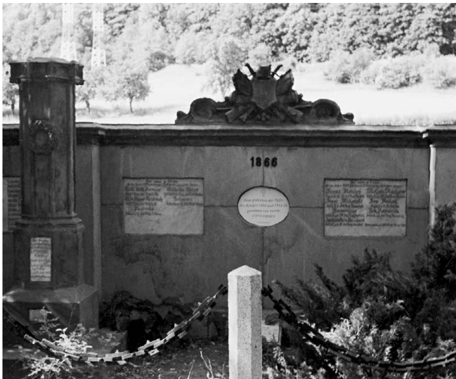
Hodkovice nad Mohelkou, soubor pomníků na místním hřbitově po celkové opravě, září 2003

Obdobně jako na jiných bojištích probíhá zpracování Generálního soupisu válečných hrobů a pomníků v regionu severních Čech. Avšak vlivem nedostačujících materiálů a chybějících informací nepostupuje zpracování tak rychle jako na jiných bojištích a místech Čech a Moravy.