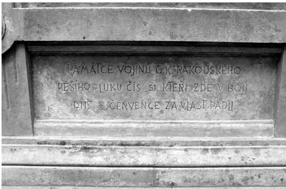
Máslojedy, detail nápisové desky pomníku 51. pěšího pluku, e.č. 386 po rekonstrukci, červenec 2003