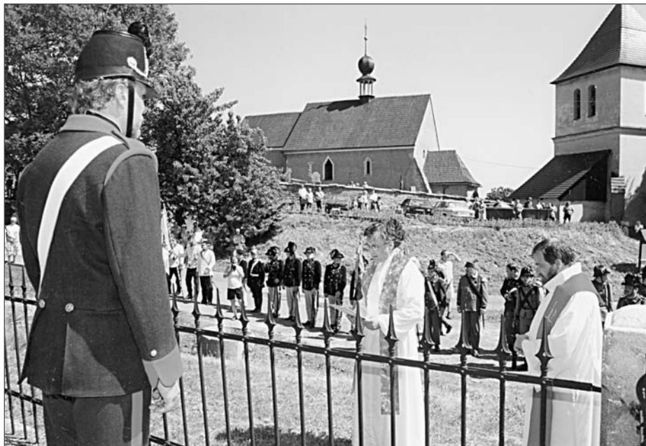
Václavice, slavnostní vysvěcení zrestaurovaného pomníku VI. armádního sboru dne 8. 6. 2003