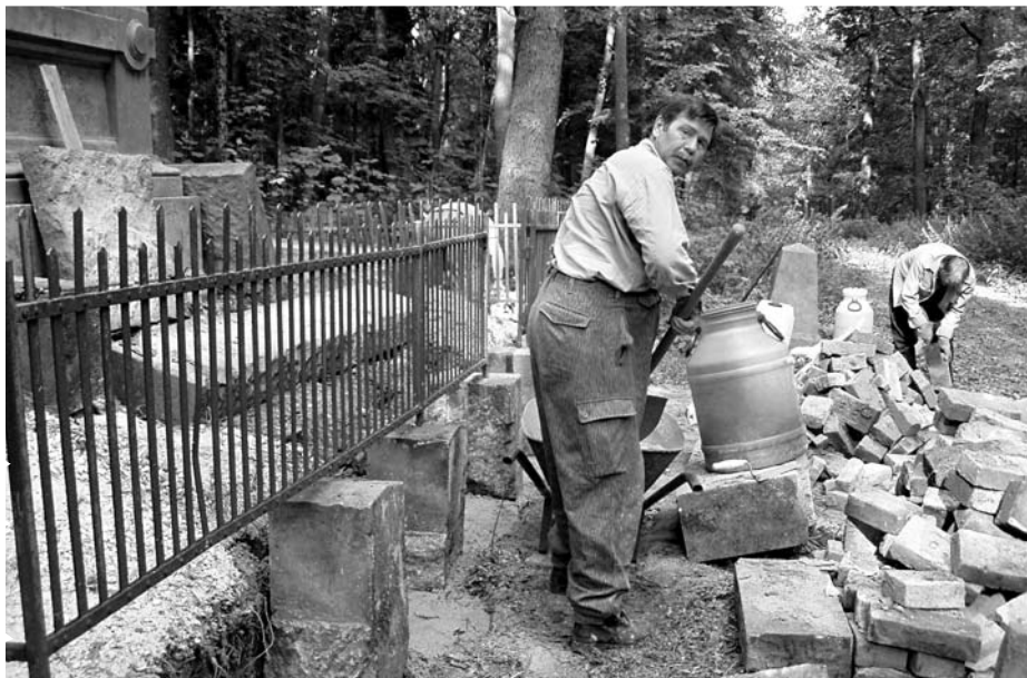
Máslojedy, oprava oplocení pomníku 51. pěšího pluku, e.č. 386, červenec 2003