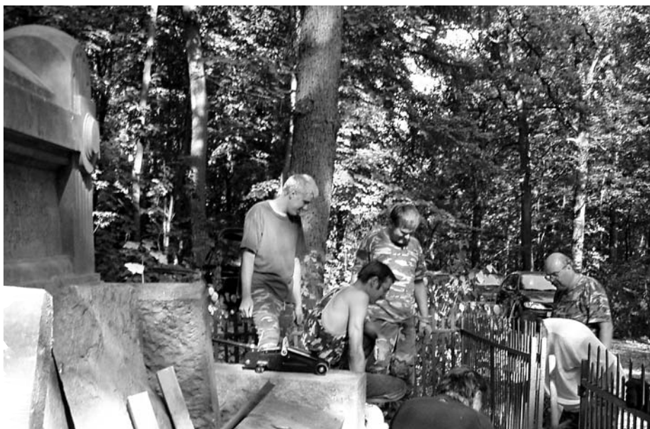
Máslojedy, oprava schodiště pomníku 51. pěšího pluku, e.č. 386, srpen 2003