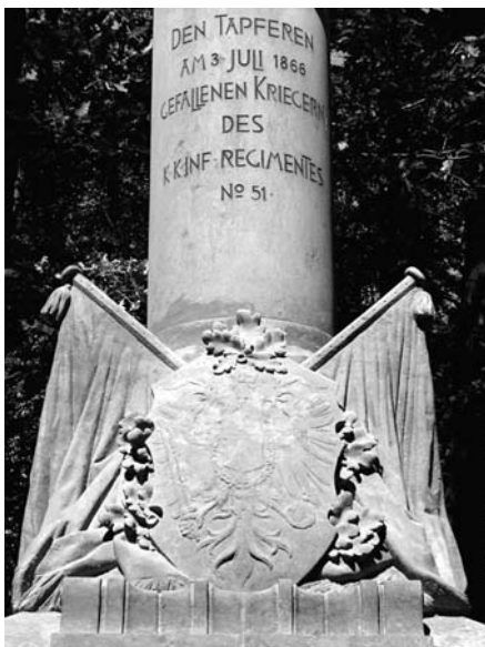
Máslojedy, detail pomníku 51. pěšího pluku, e.č. 386 po rekonstrukci