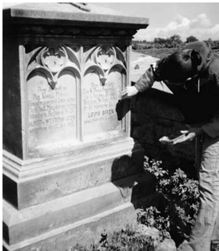
Cerekevce, restaurování pomníku pruských důstojníků, e.č. 100, červen 2003

V roce 2002 se podařilo Komitétu 1866 získat z Krajského úřadu Královéhradec-kého kraje prostředky na sejmutí a úschovu cenných kovových plastik a částí pomníků z války roku 1866 na bojišti u Hradce Králové. V závěru roku 2003 se Komitét 1866 dohodl s Muzeem východních Čech v Hradci Králové zahájit výrobu kopií těchto plastik a nápisových desek a jejich postupné osazování na jednotlivé pomníky. Muzeum na tuto výměnu poskytlo 30 000 Kč, Komitét financuje zbývajících 70 000 Kč této I. etapy, která bude realizována v 1. čtvrtletí 2003.