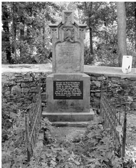
Vlčice, pomník 3 padlým vojákům e.č. 68, na hřbitově, po rekonstrukci kamene, srpen 2003

Práce se nezastavily ani na opravách drobných vojenských pomníků a hrobů. Byl zhotoven nový ozdobný litinový kříž na pískovcovém soklu hrobu pruského mušketýra Wojkeho, e.č. 6 na městském hřbitově a s ním totožný na masovém hrobu u staré cesty do Starého Rokytníku v lokalitě Rozcestí za hájovnou. Dále byla provedena výroba a rekonstrukce kříže na hrobě setníka Mahra, e.č. 24 u Janské kaple. Současně s osazením křížů byl vždy kamenný sokl restaurován a barevně zvýrazněny nápisy. Zároveň s touto akcí byl vyroben a osazen nízký sokl pod mramorový pomník kadeta 16. praporu polních myslivců F. Drechslera, e.č. 27 u Janské kaple, který se v minulosti ztratil.