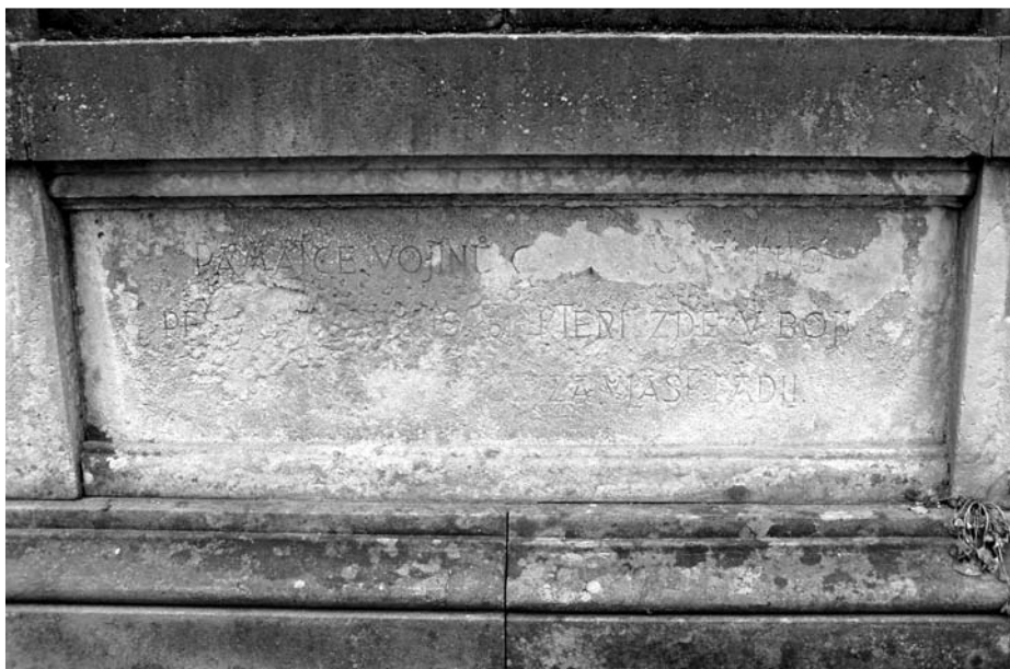
Máslojedy, detail pomníku 51. pěšího pluku, e.č. 386 před rekonstrukcí, říjen 2002