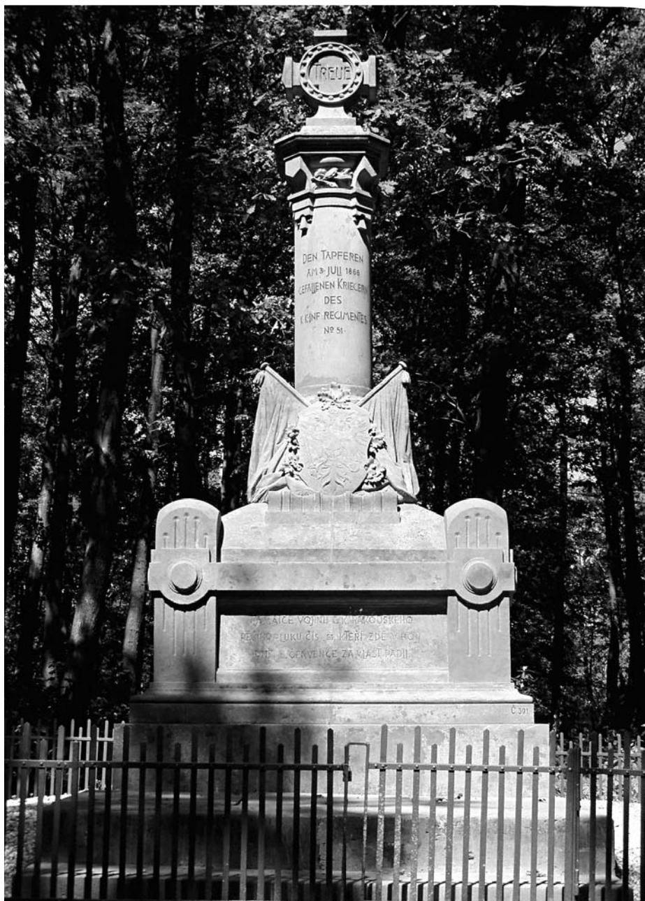
Máslojedy, pomník 51. pěšího pluku, e.č. 386 po rekonstrukci, září 2003