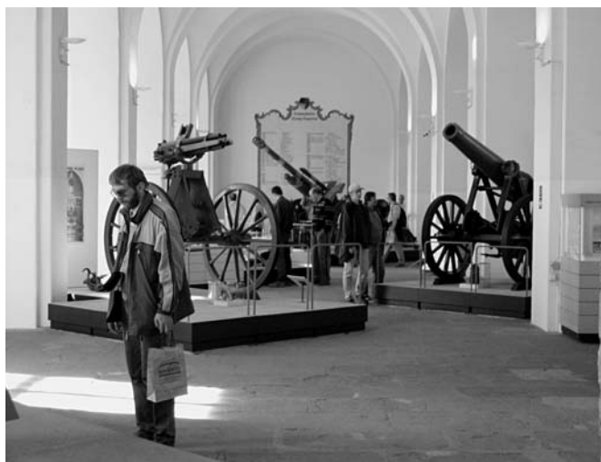
Expozice v muzeu pevnosti Königstein