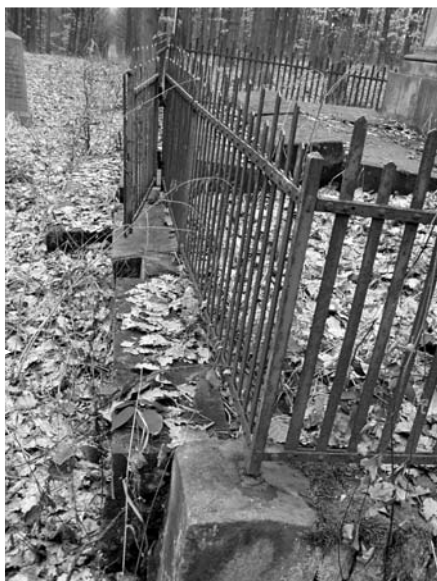
Máslojedy, detail oplůtku pomníku 51. pěšího pluku, e.č. 386, říjen 2002 před rekonstrukcí

Celkově lze konstatovat, že stav okolí mnohých pomníků je průběžně udržován, ať jednotlivci, tak i obecními úřady, což ještě před několika lety byla věc téměř nemyslitelná.