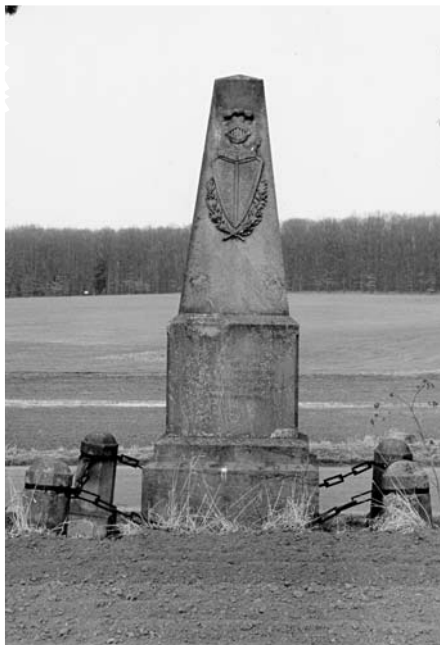
Čistěves, pomník 61. pěšího pluku, e.č. 34 před rekonstrukcí, duben 2003