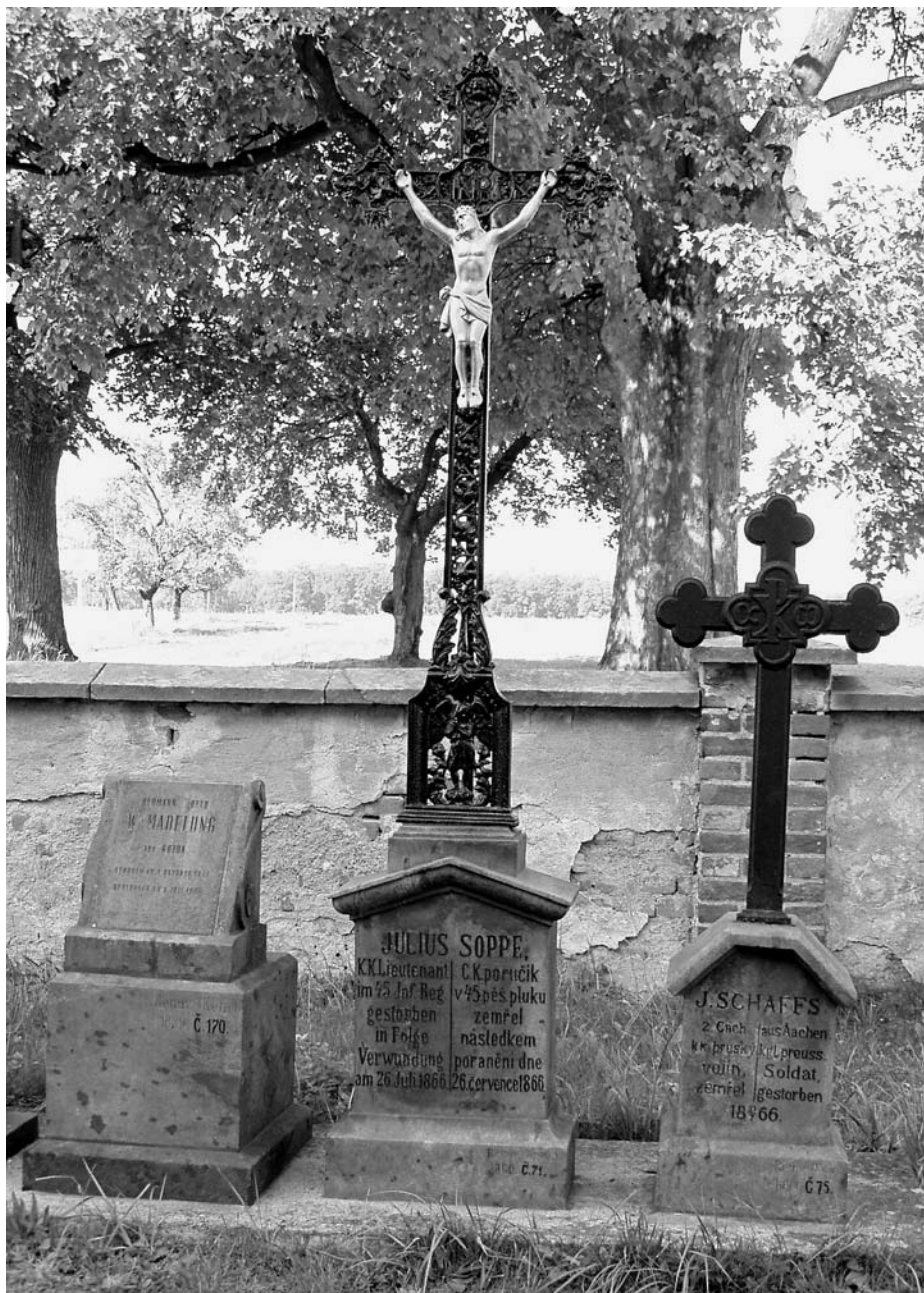
Hrádek, pomníky na místním hřbitově e.č. 170, 71 a 75 po restaurování, srpen 2003