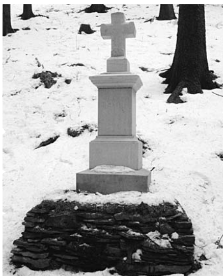
Náchod - Bražec, pomník 2 padlých vojáků, e.č. 41, stav prosinec 2003