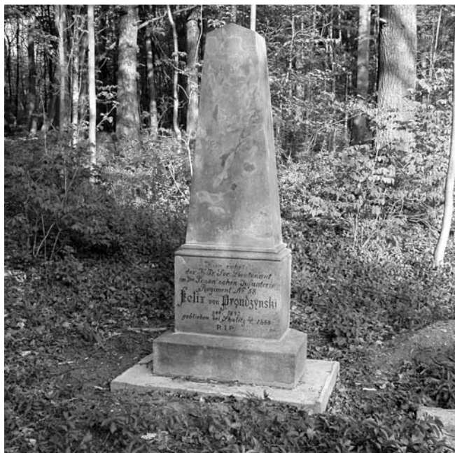
Česká Skalice - Dubno, pomník pruského poručíka Prondzinského, e.č. 2, v průběhu opravy, červenec 2003