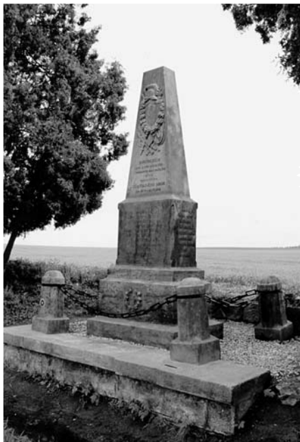
Čistěves, pomník 61. pěšího pluku, e.č. 34, po celkové rekonstrukci, červen 2003