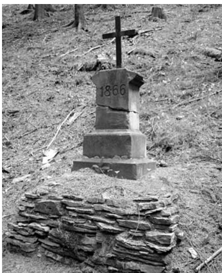
Náchod - Bražec, pomník 2 padlých vojáků, e.č. 41, stav červen 2003