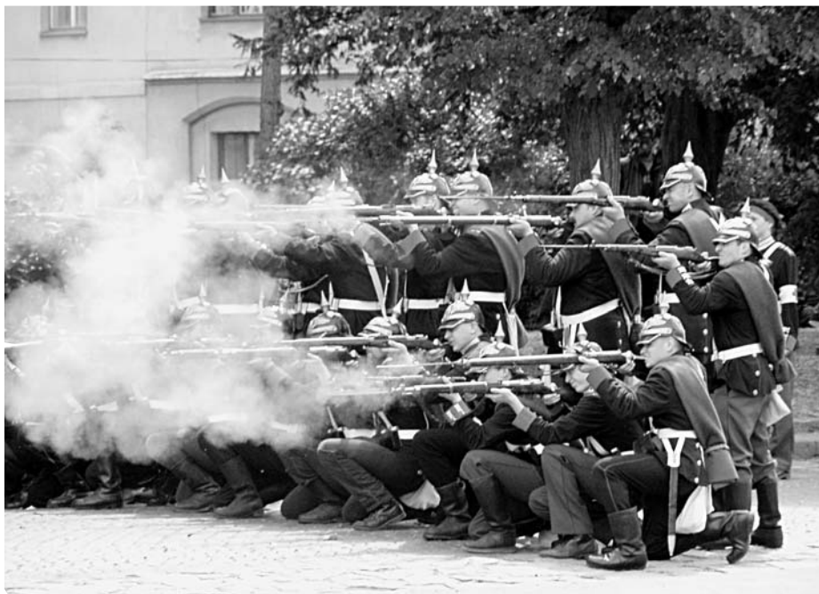
Historická jednotka pruské gardy z Předměřic nad Labem při bitevní ukázkě v Nechanicích

Ve výroční den bitvy u Hradce Králové, který v roce 2003 připadl na čtvrtek, proběhlo slavnostní odhalení repliky pamětní desky protektora ústředního spolku Viléma prince ze Schaumburg-Lippe. V podvečer 3. července se v prostoru