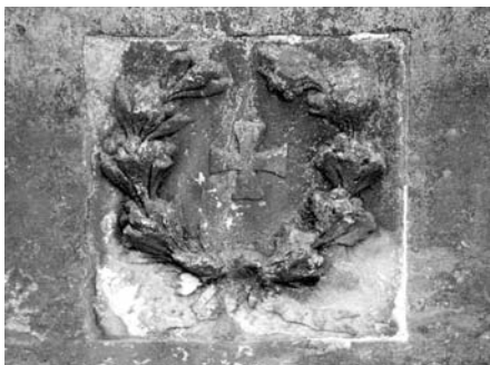
Čistěves, detail pomníku 61. pěšího pluku, e.č. 34, před restaurováním, duben 2003