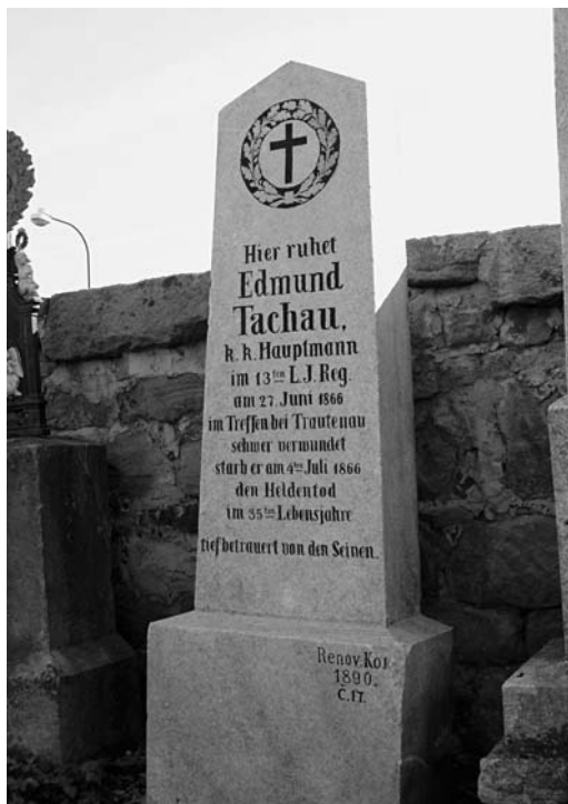
Choustníkovo Hradiště, pomník setníka Edmunda Tachau, e.č. 45, září 2003

Provedením odborné restaurátorské části prací byl pověřen akad. sochař Jiří Kašpar z Mostku. Pomníky byly očištěny parou pod tlakem, povrch zpevněn prostředkem Porosil W, byly vyňaty nevhodné korodující čepy a staré vysprávky, nasazen litinový kříž, který na pomníku chyběl od roku 1978, tmelení organokřemičitým tmelem na bázi Sokratu 2802A, hydrofobizace postřikem silikonové pryskyřice Repesil Sch05, pomníky biocidně ošetřeny Bio-