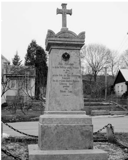
Sviništany, pomník 37. pěšího pluku, e.č. 1, po restaurování, prosinec 2003