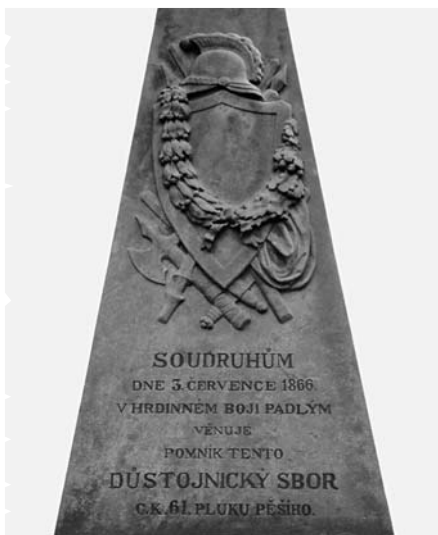
Čistěves, detail pomníku 61. pěšího pluku, e.č. 34, po restaurování, červen 2003