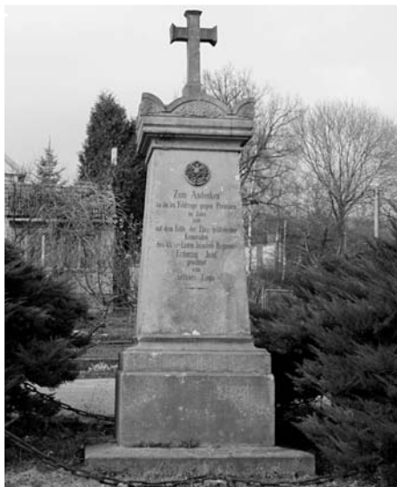
Sviništany, pomník 37. pěšího pluku, e.č. 1, před celkovou rekonstrukcí v červnu 2003