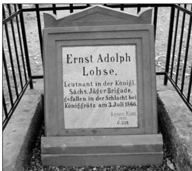
Detail pomníku saského por. Lohse v Rosnicích, e.č. 258

na vrcholu v Novém Bydžově (40.460 Kč) a v Rosnicích pomníky e.č. 258 - saského por. Lohse v zahradě čp. 28 (40.460 Kč), e.č. 259 - pyramida věnovaná pruskému vojínovi, který podlehl zranění v čp. 29 (10.710 Kč), e.č. 260 - pyramida všeobecného věnování (19.040 Kč) a e.č. 261 - mohutná pyramida s dělovým křížem na vrcholu na hromadném hrobě (17.850 Kč).