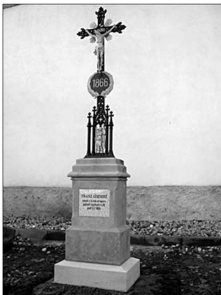
Pomník rakouského setníka Franze Lehnerta, e.č. 90