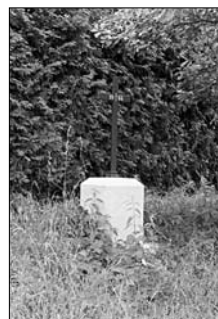
Oprava šachetních křížů na vojenském hřbitově v Máslojedách, e.č. 310, 311 a 312 (nalevo), na vojenské hřbitově v Nedělišticích, e.č. 326, 329 a 388 (uprostřed) a na školní zahradě na Probluzi, e.č. 332 (napravo)