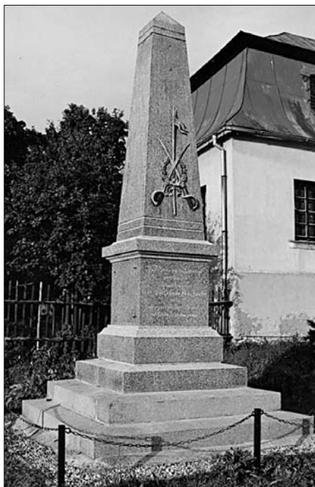
Dlouhý Most, centrální pomník, 2007