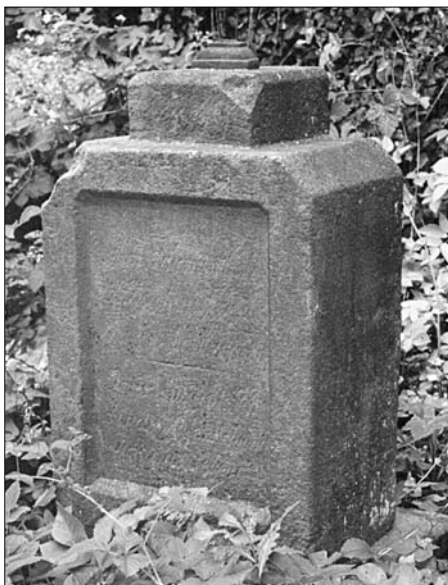
Torzo pomníku v Rudolticích