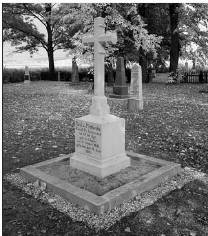
Celková rekonstrukce vojenského hřbitova u Zlíče ještě bez opraveného oplocení

Asi největším počinem na skalickém bojišti za posledních několik let je již zahájená celková rekonstrukce vojenského hřbitova u Zlíče. V první fázi prací již bylo opraveno 17 pomníků a typových křížů. V dalších fázích budou opraveny zbývající pomníky a přijde na řadu nákladná rekonstrukce oplocení. Několik ulámaných původních sloupků z tehdejšího oplocení bylo během prací nalezeno pod některými pomníky jako zpevňující základ. V poslední řadě projde hřbitov obnovou parkové úpravy do původní podoby a budou zvýrazněny původní rovy přesně jako na starých fotografiích z přelomu 19. a 20. století. Veškeré kamenické práce provádí osvědčená firma Kamenictví Novotný z Čermné. Ti také právě dokončili restauraci pruského pomníku evidenční číslo 57 na obecním hřbitově v Hoříčkách. V těchto podzimních dnech také osadí nový pomník nad hrobem rakouského pěšáka v Dubenské bažantnici, jehož ostatky byly nalezeny v roce 2005.