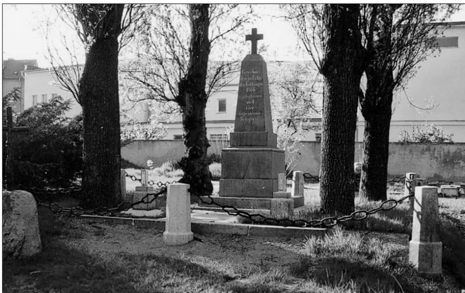
Liberec, opravený centrální pomník, jaro 2008