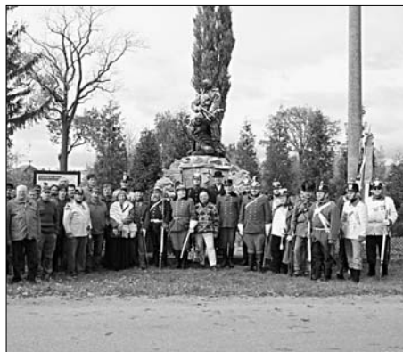
Pomník pěšího pluku č. 4 Hoch-und Deutschmeister v Rozběřicích, e.č. 343