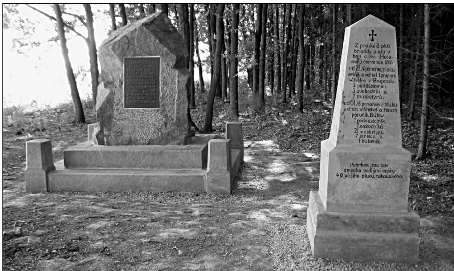
Pomník pruské 8. pěší brigády a rakouského plukovníka V. Bindera, e.č. 9, pyramida věnovaná padlým pruské 8. pěší brigády a rakouského pěšího pluku č. 49, e.č. 247