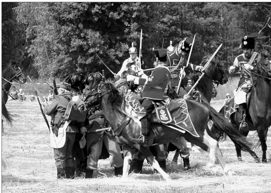
142. výročí krvavé bitvy u Hradce Králové