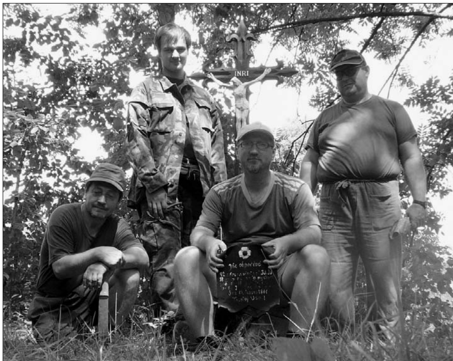
Účastníci brigády na jičínském bojišti 26. 7. 2008