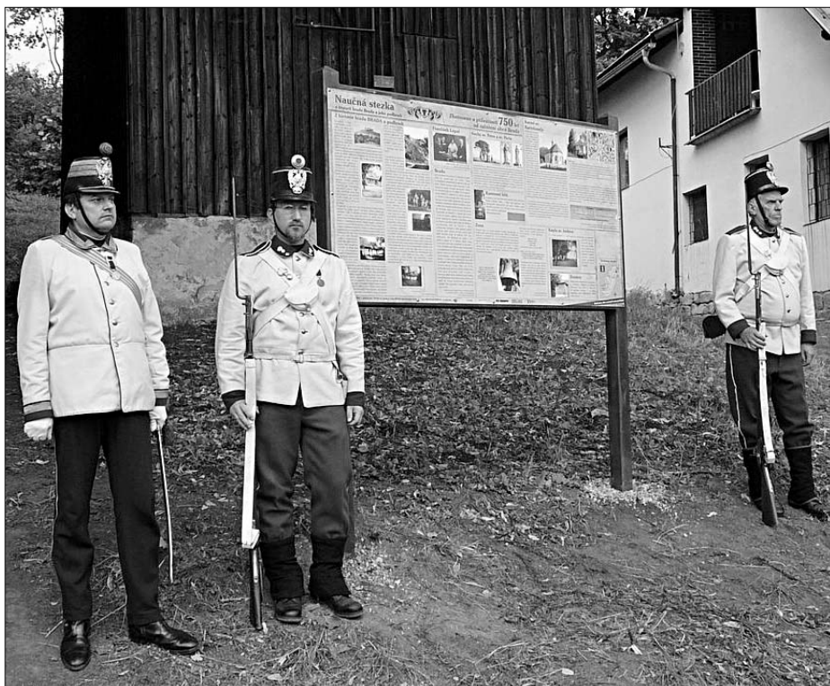
Slavnostní otevření naučné stezky „O historii hradu Brada a jeho podhradí“, dne 9. 8. 2008

Na závěr děkuji všem členům Komitétu, kteří se účastní brigád a také všem těm, kteří se zaslouhují o dobrou propagaci bojiště.