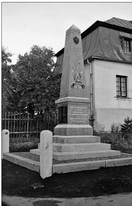
Dlouhý Most, centrální pomník, 19. 10. 2008