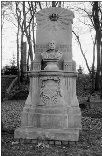
Pomník saského krále Alberta, e.č. 400