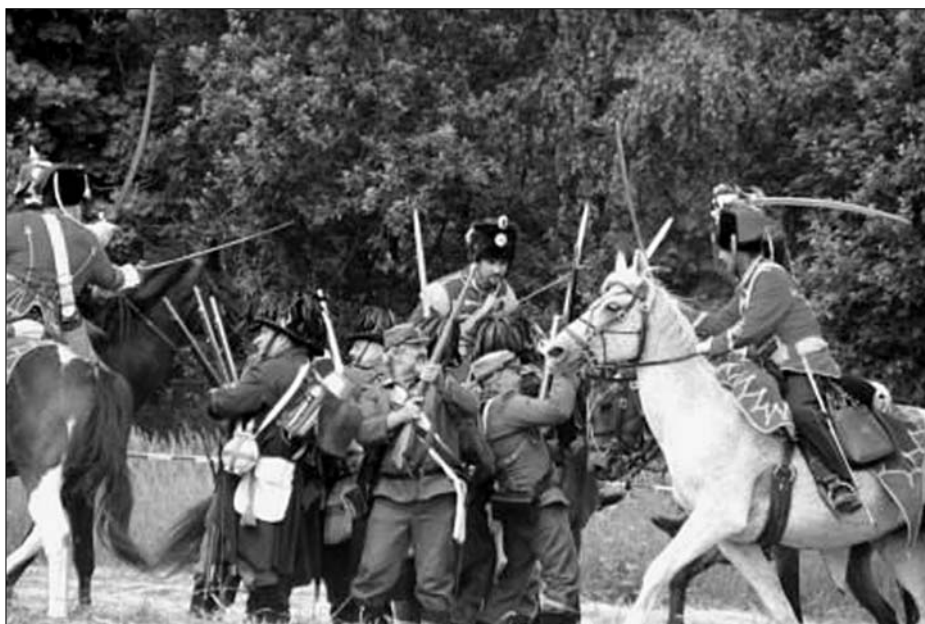
142. výročí prusko-rakouské války v Kuřívodech

Podzimní akce byly tentokrát rozděleny - tradiční dušičková vzpomínka na padlé se uskutečnila 25. října 2008 u zničeného pomníku dělostřeleckého pluku č. 6 v polích mezi Chlumem a Nedělišťemi. Podzimní 25. Valná hromada Komitétu 1866 se konala o tři týdny později v sobotu 15. listopadu netradičně v Praze. Dopoledne se členové spolku sešli v restauraci Bowling Skalka na Praze 10, kde proběhlo