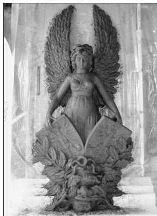
Detaily plastik - model