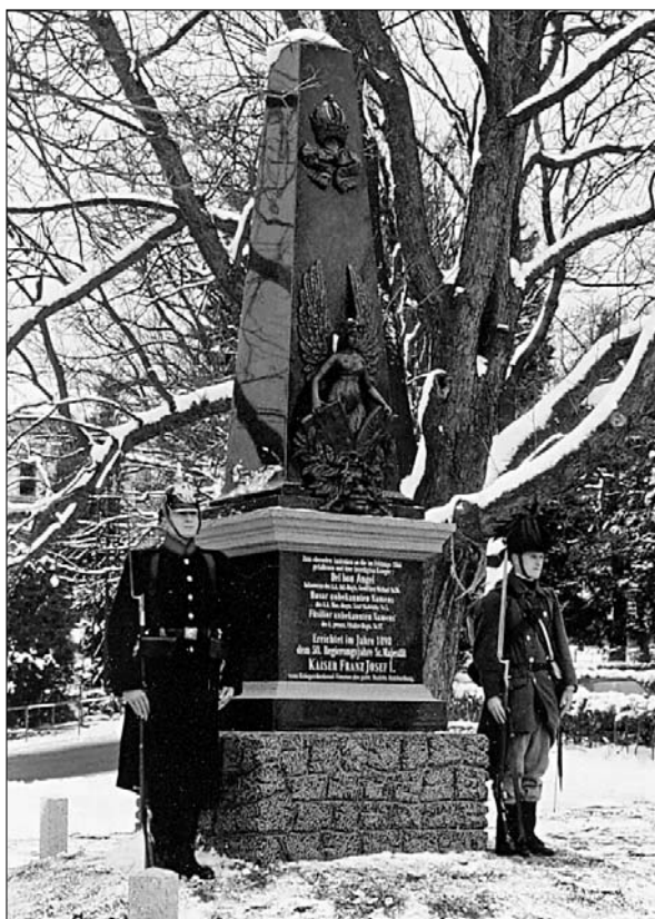
Chrastava, odhalení pomníku z války roku 1866, 24. 11. 2008