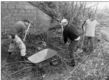
Brigáda na bojišti dne 18. 10. v prostoru železničního viaduktu u silnice Česká Skalice - Náchod