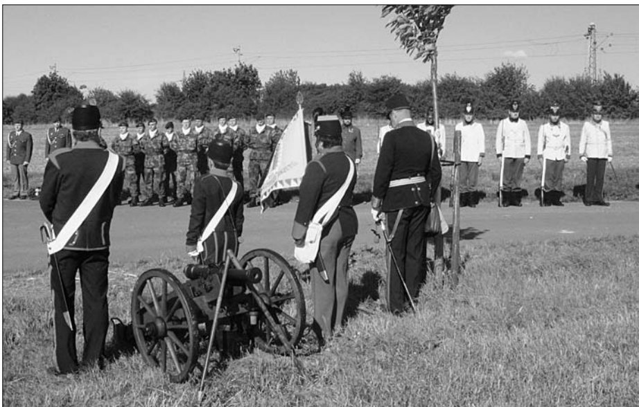
Slavnostní odhalení dne 13. 9. 2008 zrekonstruovaného kříže u Čechůvek na Prostějovsku, e.č. 11