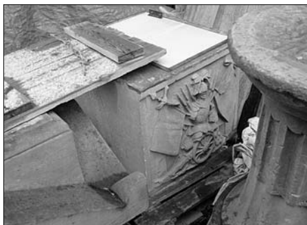
Rekonstrukce centrálního pomníku ve Dvoře Králové nad Labem, e.č. 5