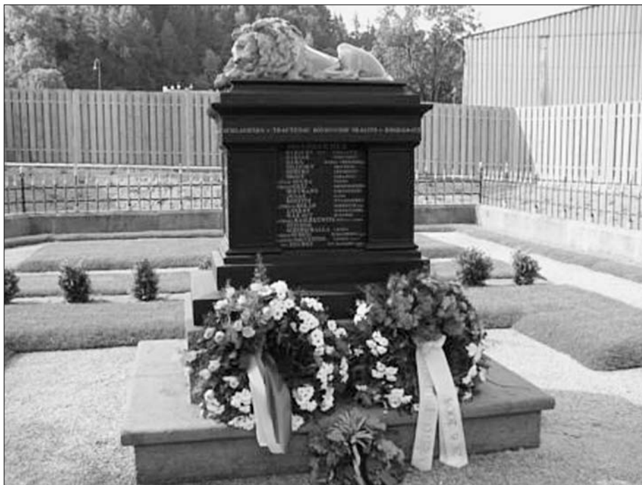
Opravený pomník na vojenském hřbitově z roku 1866 ve Velkém poříčí

V roce 2007 byla provedena celková obnova vojenského hřbitůvku (e.č. 1) vedle areálu TS Trutnov v Náchodské ulici. Opravy se týkaly především samotného pomníku a oplocení hřbitova a hrubých terénních úprav. Letos byla oprava završena stavbou vhodného oplocení, které by vkusně oddělovalo provozní areál technických služeb od obnoveného hřbitova. Dřevěné oplocení s kamennou podezdívkou bylo postaveno nejen v bezprostředním sousedství hřbitova, ale z iniciativy Technických služeb a s pomocí Lesů a parků Trutnov také podél Náchodské ulice. Veřejné prostranství bylo při této příležitosti upraveno a uklizeno. Tím dostalo celé okolí hřbitova kultivovanější a důstojnější ráz. Byla dokončena oprava přesunutého kamenného kříže, který dříve stával uprostřed hřbitova, respektive v místech, kde později hřbitov vznikl. Svahy kolem hřbitova byly vyzdobeny výsadbou okrasných keřů, budoucí zelené plochy na hřbitově dostaly travnatý koberec a podél přístu-