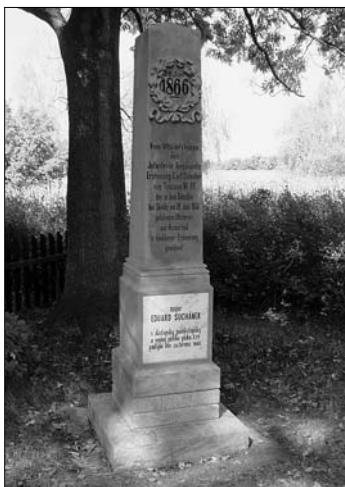
Pomník věnovaný padlým od c.k. pěšího pluku č. 77 po opravě

Na bojišti u Svinišťan byly dokončeny opravy všech typových křížů a je nyní relativně v pořádku. V příštím roce se bude třeba zaměřit pouze na pomníky u obce Miskolezy, které jsou dnes v neutěšeném stavu.