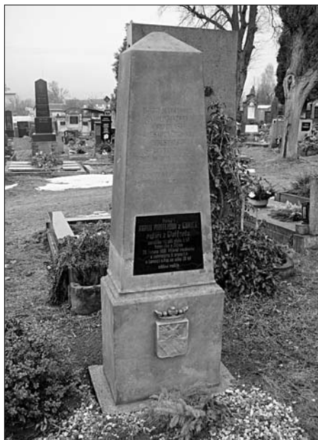
Lomnice nad Popelkou, celý soubor pomníků z války 1866 po celkové rekonstrukci, e.č. 108 - 114