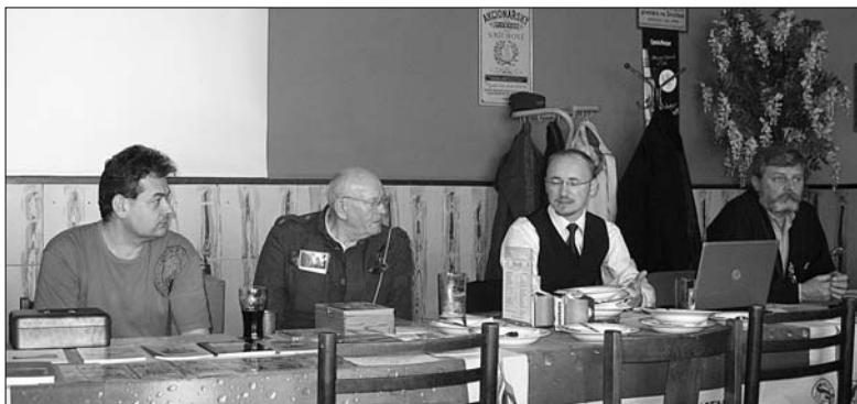
25. Valná hromada v Praze

předpokladem ke změně této situace se zde jeví rozvíjející se spolupráce mezi Komitétem a samosprávami na poli získávání dotací z grantového programu MO ČR na opravu válečných památek. Komitét zde poskytuje informace k žádostem o grant, zajišťuje odborné posouzení stavu předmětných památek a v mnoha případech garantuje vlastní realizaci.