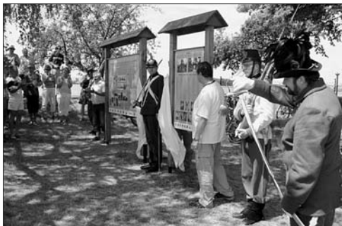
Slavnostní odhalení informační tabule u tovačovského pomníku e.č. 1