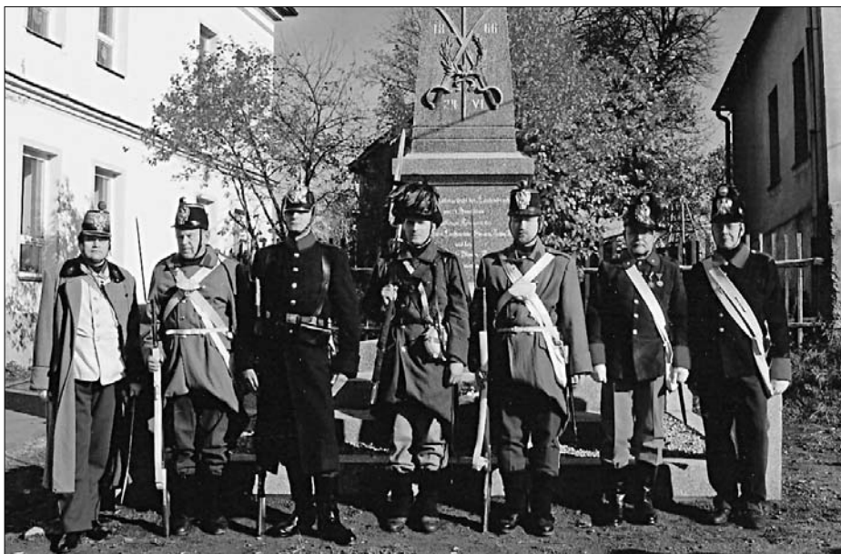
Dlouhý Most, pietní akt u centrálního pomníku, 1. 11. 2008