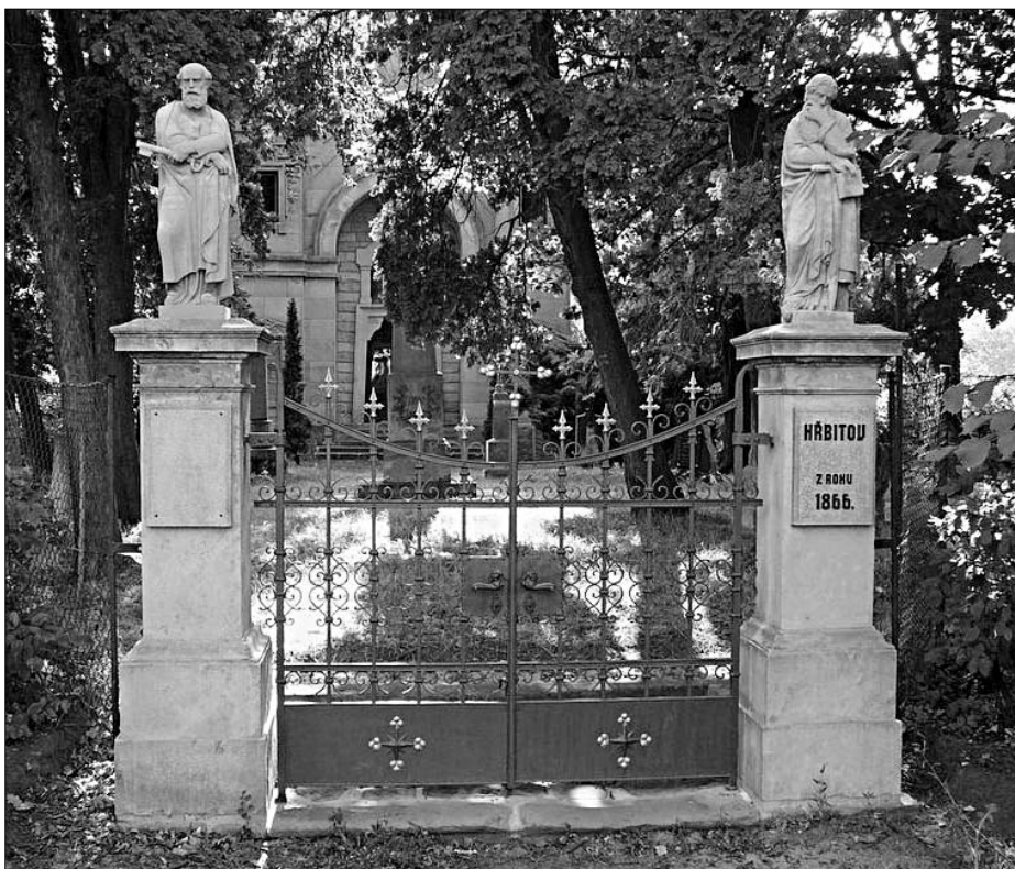
Kbelnice - repliky soch světců sv. Petra a sv. Pavla 26. 7. 2008