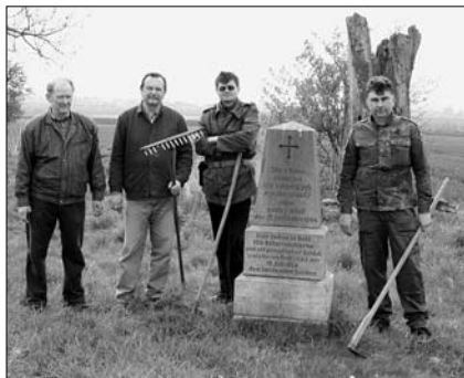
Brigáda na Tovačovsku