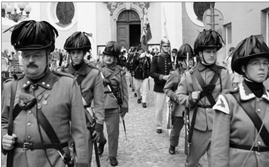
Pochod historických jednotek z Trutnova do Velkého Poříčí dne 24. 6. 2008

V roce 2007 opravený jehlanec (e.č. 81) u silnice do Studence byl další letošní památkou, která změnila svoji tvář k lepšímu. Celé okolí bylo nově upraveno. Loňskou vichřicí poničené a nevhodné stromy a keře byly ještě v předjaří odstraněny, terén později upraven a oset trávou. Částečně vyvrácené pařezy a nepořádek z pole byl odvezen. Hromadný hrob před pomníkem byl, jako již tradičně, zvýrazněn uměle navršeným rovem a opatřen zábradlím. Prostor tak dostal podobu, jaká je známá z dochovaných historických pohlednic a fotografií. Po vypořádání majetkových poměrů u dotčených parcel bude ještě v budoucnu areál opatřen ozdobným dřevěným oplocením.