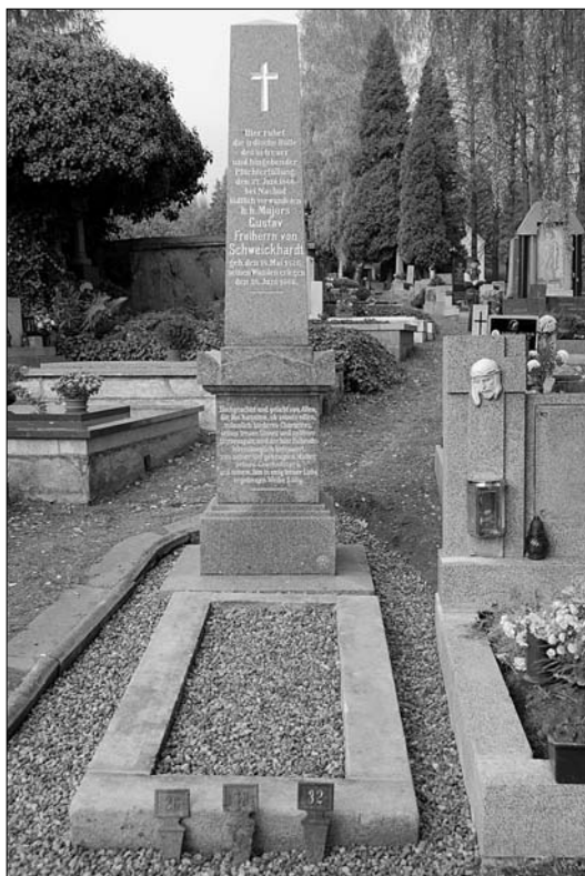
Pomník majora Gustava svobodného pána von Schweickhardta, e.č. 26