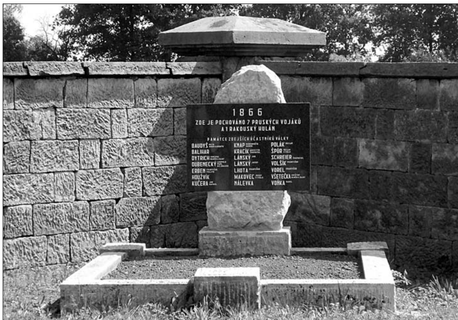
Miletín, nová podoba hrobu