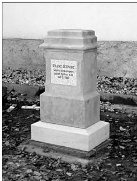
Torzo pomníku rakouského setníka Franze Lehnerta, e.č. 90