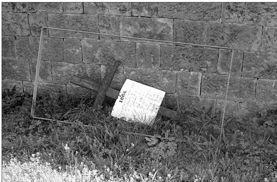
Miletín, původní dřevěný kříž