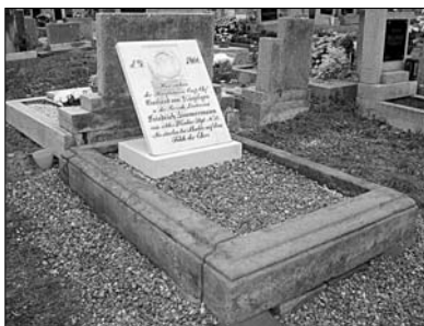
Pruský pomník na obecním hřbitově v Hoříčkách, e.č. 57