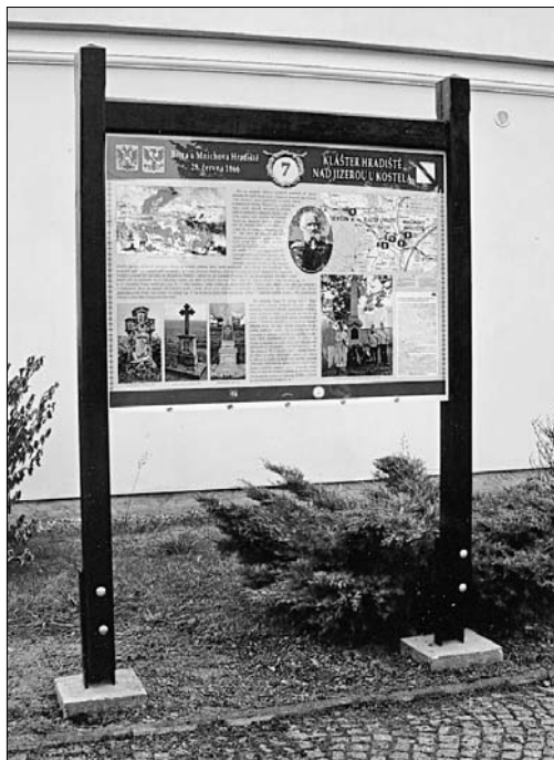
Klášter Hradiště nad Jizerou, tabule č. 7 naučné stezky „Mimoň-Boseň“, 6. 12. 2008

Ve dnech 22. a 23. prosince bylo jménem Komitétu 1866 poděkováno za spolupráci v roce 2008 a zároveň popřáno k Vánocům a k novému roku následujícím samosprávám: Městský úřad Chrastava, Obecní úřad Dlouhý