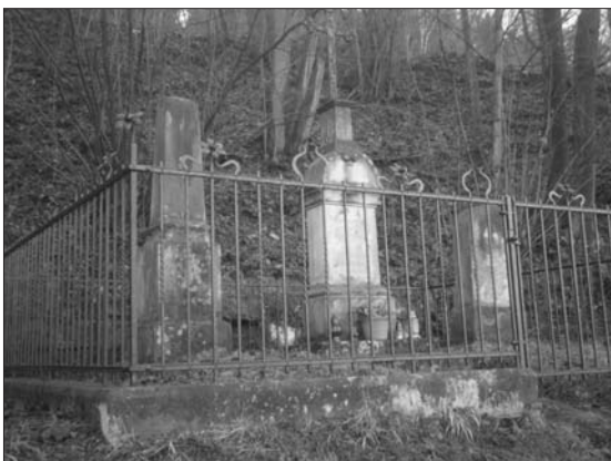
Oplocení pomníků pod nádražím po opravě

V roce 2013 byl z rozpočtu města přidělen grant na nátěr a opravu kovaného oplocení souboru pomníků pod nádražím v částce 15.000 Kč. Práce byly provedeny v srpnu a září 2013 pod mým vedením Technickými službami města Dvora Králové nad Labem.