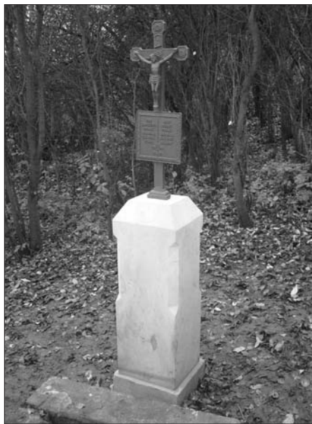
Obnovený pomník ev. č. 43 26. 10. 2013