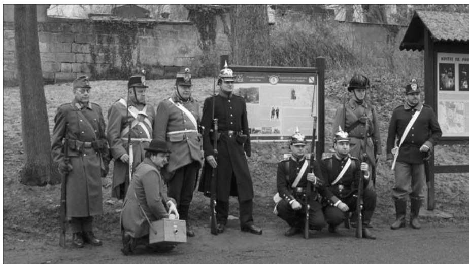
Odhalení naučné tabule v Hodkovicích n. M.