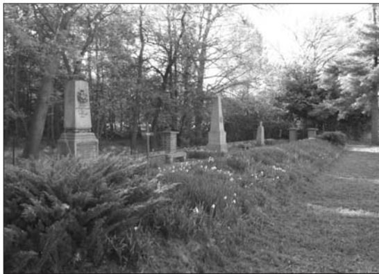
Vojenský hřbitov u komárenské bažantnice