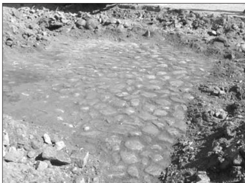
Zbytek historické dlažby na trutnovském náměstí

valouny, tzv. kočičími hlavami, které byly při stavebních pracích poblíž nalezeny jakožto pozůstatek původní historické dlažby, zachované v hloubce pod současným terénem (v roce 1968 při předlažbě náměstí žulovou kostkou byla některá propadlá místa náměstí zarovnána šterkovým zásypem). Lze proto s jistotou prohlásit, že tyto kameny, použité nyní kolem pamětní desky, jsou opravdu tou originální původní dlažbou, po níž kráčeli vojáci v roce 1866.