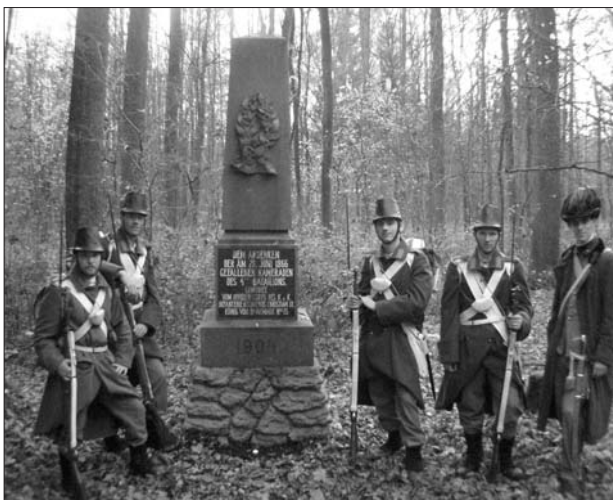
Před pomníkem 75. pěšího pluku