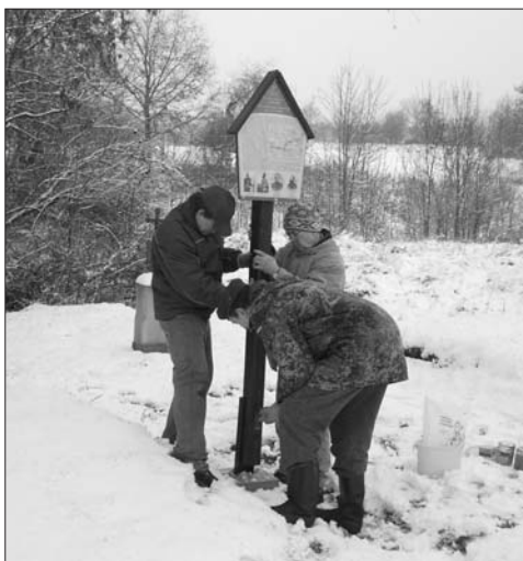
Montáž stojanu s informačním panelem u Sychrova 8. 12. 2013