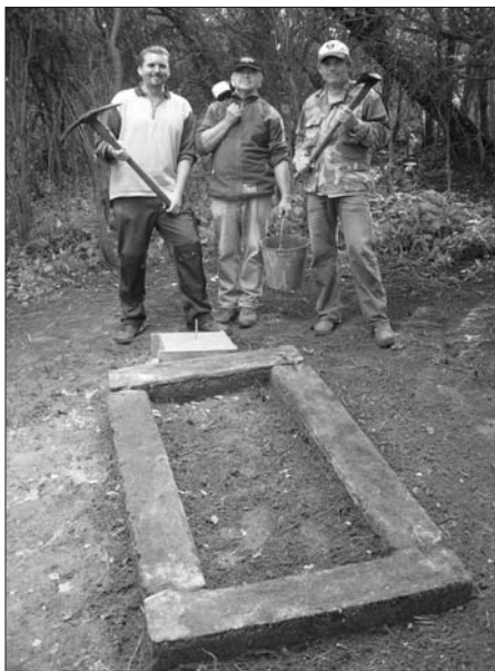
Betonování základu pomníku ev. č. 43 14. 9. 2013