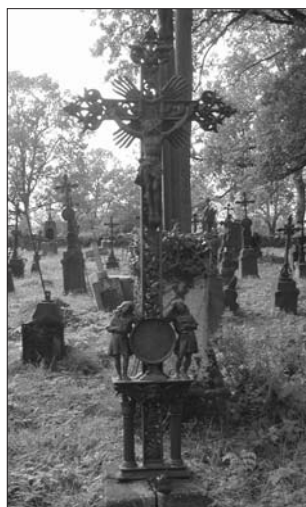
Kříž použitý pro výrobu licího modelu