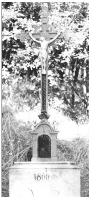
Historická fotografie kříže ev. č. 45

kteřý bude přesně odpovídat fotografické předloze. Přizpůsobení kříže v Třebechovicích – odlití kopie jako polotovaru k úpravě do požadované podoby – by byla finančně náročná a zdlouhavá operace. Zapůjčení originálu bylo totiž termínované. Pokračování oprav bude následovat v roce 2014 (získaný epoxidový model poslouží k odlití litinového kříže a samotný kamenný podstavec projde restaurováním).