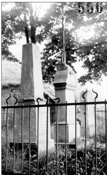
Historické foto oplocení pomníků pod nádražím

V průběhu roku byla opět prováděna běžná údržba pomníků na královédvorském bojišti, přibližně z 20 % byly očištěny přehřátou parou pod tlakem (pomníky na Starém hřbitově).