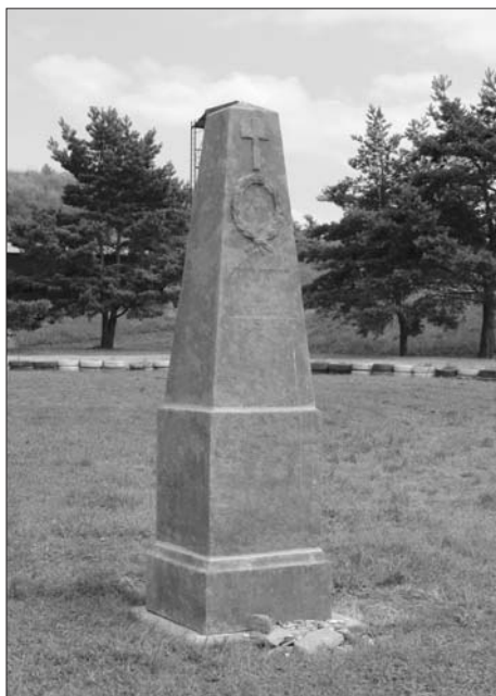
Opravený pomník na závoďišti ve Vysokém Mýtě