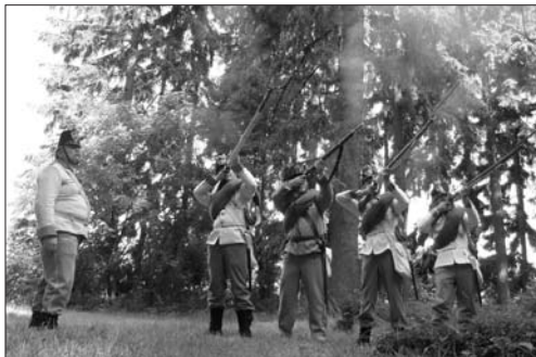
Čestná salva u Wimpffenova kříže