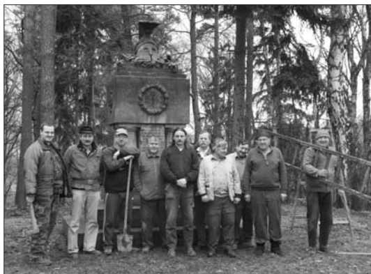
Brigáda na Prachově 13. 4. 2013