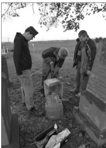
Oprava šachetních křížů U Šrámova kříže