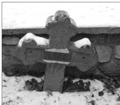
Kříž připomínající 24 pruských vojáků ve Velkém Meziříčí

J. Kozák objevil v Horním Slavkově pomník věnovaný padlým slavkovským