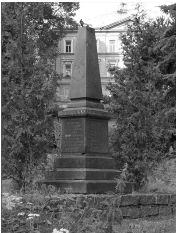
Pomník padlým občanům v Horním Slavkově

občanům z let 1848, 1859 a 1866. Z celkově 15 uvedených jmen na tomto pomníku jich v roce 1866 padlo devět.