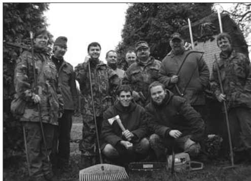
Účastníci podzimní brigády

údržbu památek ev. č. 106, 107, 83, 105 a 108. Následovala další brigáda 1. června, která však byla poznamenána velmi deštivým počasím. Na brigádu nakonec dorazil pouze M. Štěpař a O. Král, ale i tak jsme vysvobodili typové kříže ev. č. 47 a 111 z nadvlády rozrůstajících se keřů. Poslední brigáda 9. listopadu byla