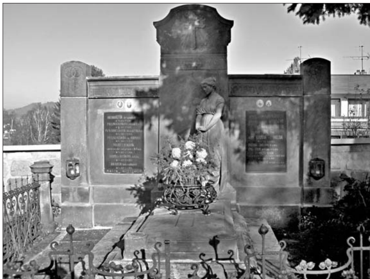
Hrobka A. Kotíka v Nové Pace

Závěrem své zprávy bych již tradičně rád poděkoval za pomoc jak členům představenstva, tak i všem shora jmenovaným.