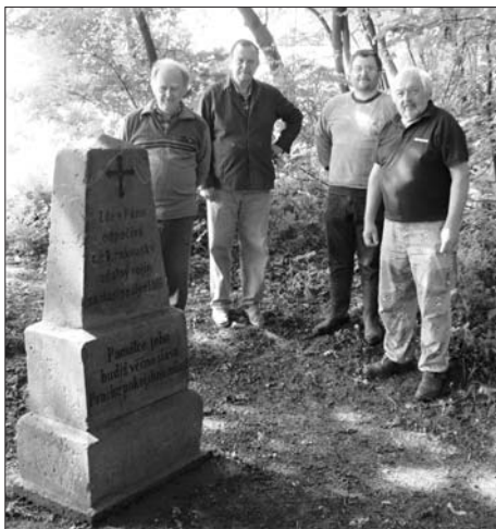
Očištěný pomník na hrázi Skašovského rybníka