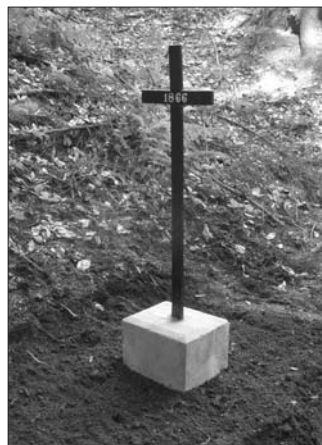
Renovace typového kříže ev. č. 44 v horní části Zádolí