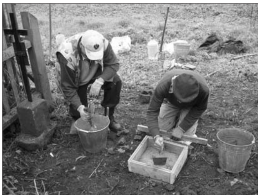
Betonování základu pomníku ev. č. 44 12. 10. 2013

Další brigáda na mnichovohradištském bojišti, při které byl zhotoven nový základ u pomníku ev. č. 44 a 45, se uskutečnila 12. října. Další práce spočívající v odstranění plevelů se potom soustředily k pomníku ev. č. 55 a k pomníkům v Přepěřích. Závěrečnou tečkou se staly pomníky ev. č. 16 – 18 společně s pomníkem věnovaným 1. světové válce