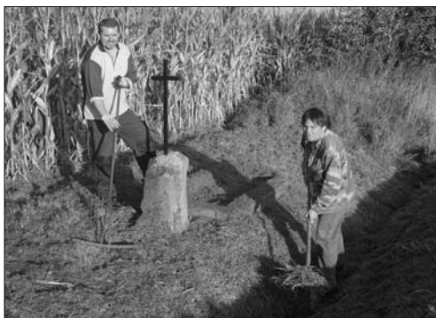
Sekání trávy 14. 9. 2013 u pomníku ev. č. 5

V sobotu 1. června 2013 proběhla ze velmi deštivého počasí brigáda na bojišti u Mnichova Hradiště. Nejdříve byl odstraněn pařez v průměru přibližně 60 cm, který se nacházel v těsné blízkosti pomníku ev. č. 9. Byl odkopán a uřezán pod úroveň terénu. Další práce se již týkaly pouze sekání trávy u pomníků ev. č. 1, 14 – 16, 18 – 20, 21, 35 a 41. Stejná činnost byla také uskutečněna na bojišti u Kuřívod a to u pomníku ev. č. 2, 3, 6, 7 a 10. U centrálního pomníku tohoto bojiště ev. č. 1 nechal trávu posekat Městský úřad Ralsko.