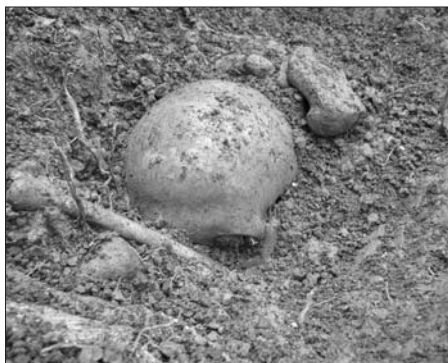
Nález neznámého hrobu v Dubně