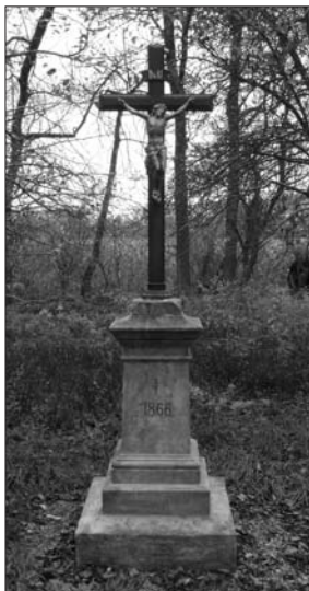
Kříž ev. č. 298 po opravě

V letošním roce se podařilo díky kamenosochařské škole v Hořicích v rámci maturitních prací opravit na královéhradeckém bojišti pět památek. Na katastru obce Všeštery to byly pomníky v Lípě ev. č. 33 (pískovcový hranol s kamenným křížem rakouského ppor. Ivichiche od pěšího pluku č. 20), v Bříze ev. č. 419 (secesní stéla pruské pěší brigády č. 21) a ev. č. 424 (pískovcová skála s křížem, věnovaná rakouským vojákům padlým na katastru obce). Na opravě těchto pomníků se podílela obec Všeštery částkou 27.000 Kč. V obci Dohalice to byly pomníky ev. č. 222 (typová pyramida na hrobě rakouských vojáků) a ev. č. 298 (litinový kříž s Kristem na hrobě rakouských a pruských vojáků). Opravu těchto památek hradil Komitét 1866 ze svých prostředků, jelikož OÚ v Dohaličkách se odmítl na opravě finančně podílet. Přípravu pomníků před jejich restaurováním (odstranění vegetace v jejich okolí) provedli v předstihu 25. 4. 2013 J. Vilím a P. Mrkvička u památek ev. č. 298, 419 a 424. Obecní úřad Máslojedy vyčlenil finanční prostředky na opravu pomníku ev. č. 453 na společném hrobě, kde byl původně pohřben rakouský plk. generálního štábu IV. armádního sboru Görtz von Zertin, který se povedlo s několika problémy opravit.