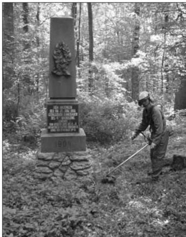
Brigáda v dubenské bazantnici (foto T. Vondryška)

Vzhledem ke svému značnému pracovnímu vytížení jsem se v minulém roce nemohl věnovat údržbě bojišť u České Skalice a Svinišťan v takové míře, jak bych si představoval. Přesto jsem alespoň zajistil základní údržbu okolí pomníků na