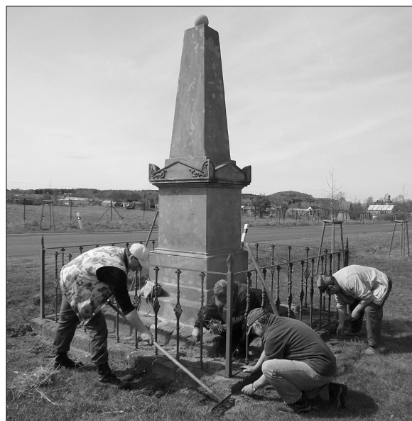
Úprava okolí pomníku ev. č. 1 u Kuřívod 12. 4. 2015

a tak 12. dubna veškeré odpadky podél obou stran silnice E268 mezi pomníky ev. č. 1 až 13 pohltilo 17 igelitových pytlů, které následně zlikvidoval Městský úřad Ralsko. Stejně jako v letech minulých brigádníci vyhlásili nejkurióznější předmět, a tím se jednoznačně stal plyšový slon. Všechny naučné tabule na kuřívodském bojišti a stejně tak i tabule v Mímoně byly očištěny od nečistot. Bez patřičného zájmu nezůstaly ani vlastní pomníky na uvedeném bojišti, a tak uhrabání a úklid jejich nejbližšího okolí se staly závěrečnými pracemi v této lokalitě. Stejně aktivity byly odpoledne přeneseny na