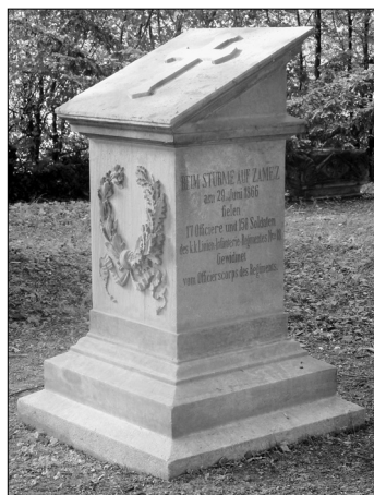
Opravený pomník 18. pěšího pluku, Kbelnice 26. 5. 2015

Členové historického kroužku Muzea přírody Český ráj a kadetní setniny jičínského pěšího pluku č. 74 se 16. dubna zapojili do péče o pomníky. V obci Prachov uhrabali okolí pomníků naproti kioskům.