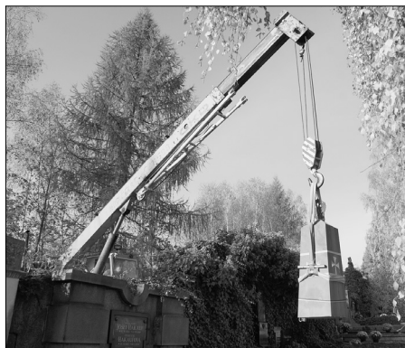
Manipulace s památkou ev. č. 25 na Staroměstském hřbitově