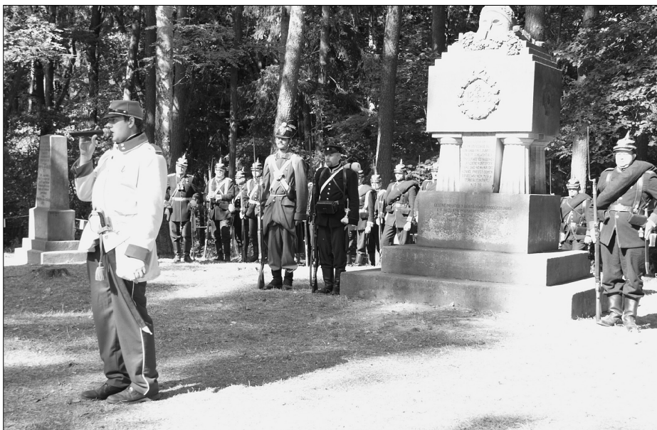
Pietní akt v Prachově 19. 9. 2015

protestantském hřbitově. Účastníci akce si pak mohli na náměstí vyslechnout koncert skupiny Kantoři. Nedělní pouť ke sv. Jiljí byla oživena přítomností vojáků v uniformách z roku 1866, kteří tak obyvatelům Svitav připomněli dramatické události v průběhu tohoto válečného roku odehrávající se v jejich městě.