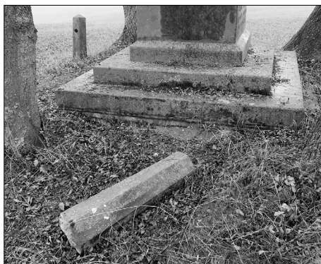
Uražený sloupek u pomníku na Luňáčku 7. 11. 2015

Chtěl bych moc poděkovat všem členům, kteří se účastní spolkových brigád a všem těm, kteří přispívají finančně na opravu pomníků.