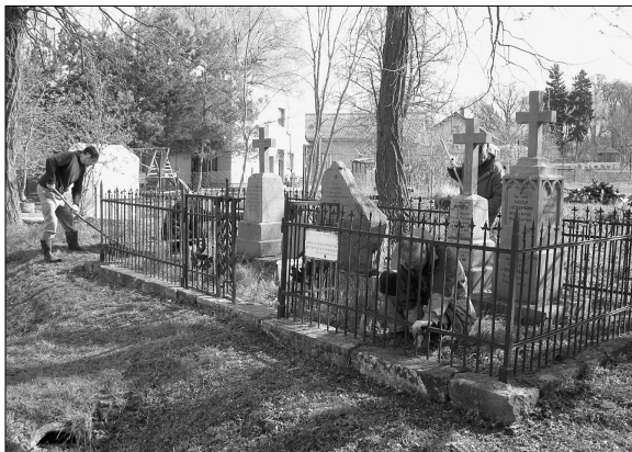
Saský hřbitov u Dolního Přímu 18. 4. 2015