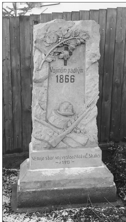
Pomník ev. č. 54 po terénních úpravách