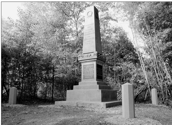
Opravený pomník 40. pěšího pluku u Hoříněvsi (J. Synek, září 2015)