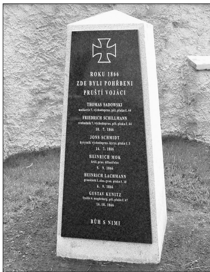
Nový pruský pomník ve Svítavách