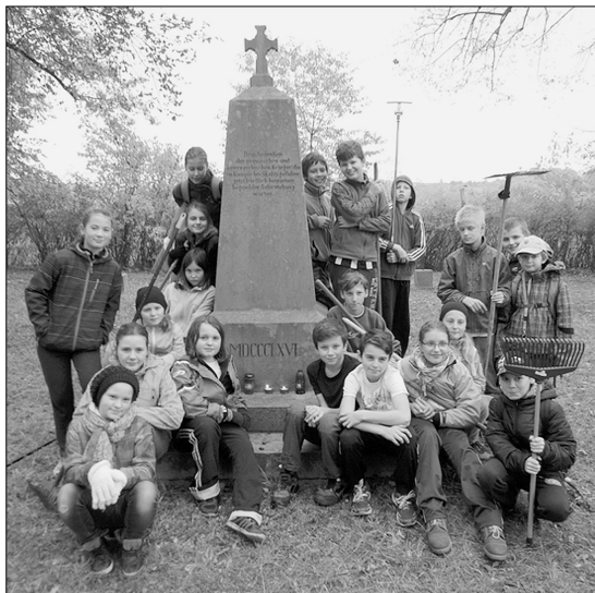
Brigáda 5. A na vojenském hřbitově 27. 10. 2015

Na žádost českoskalické základní školy jsem připravil pro třídu 4. A zajímavý výlet. Společně s kamarády v dobových uniformách jsme s dětmi navštívili nejzajímavější místa někdejšího bojiště. S výkladem upraveným pro dětské