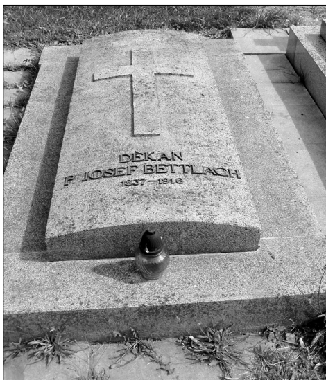
Deska na hrobě děkana Bettlacha v Jilemnici