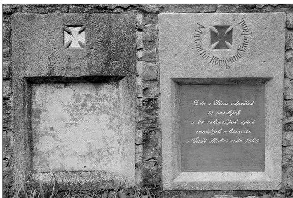
Pamětní deska ev. č. 50 před a po opravě