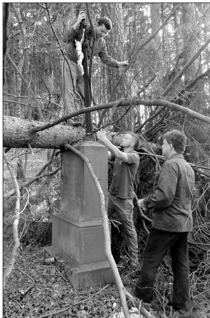
Odejmutí litinového kříže z poškozené památky ev. č. 80 ve Václavicích