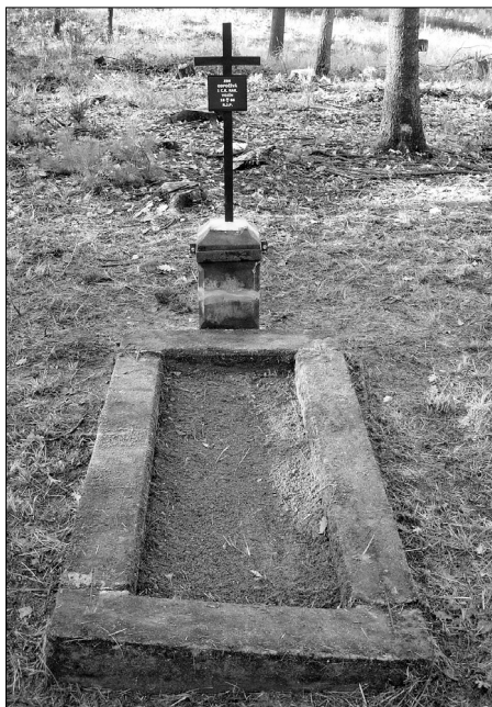
Kříž ev. č. 52 u Mužského před a po opravě (J. Náhlavský srpen a listopad 2015)