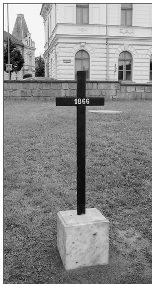
Nový typový kříž u Kohoutova Dvora

Vedení města požádalo na sklonku roku 2014 o dotaci na zabezpečení péče o válečné hroby poskytovanou v rámci programu ISPROFIN č. 107 190