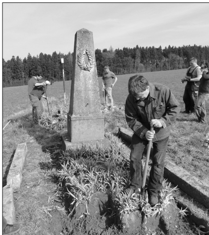
Demontáž původního oplocení památky ev. č. 69

14. srpna započala renovace dvou památek na Staroměstském hřbitově v Náchodě (ev. č. 30 a 25) jejíž financování zajistilo město Náchod. V případě centrálního pomníku na hromadném hrobě vojáků zemřelých na následky zranění v bitvě u Náchoda si zásah na této památce vyžádal nejen celkovou údržbu kamene, ale i vyzvednutí samotného pomníku na nový vyvýšený pískovcový stu-