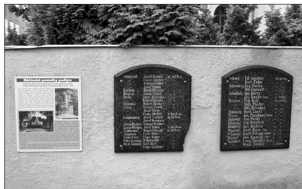
Desky z pomníku padlých v Děčíně