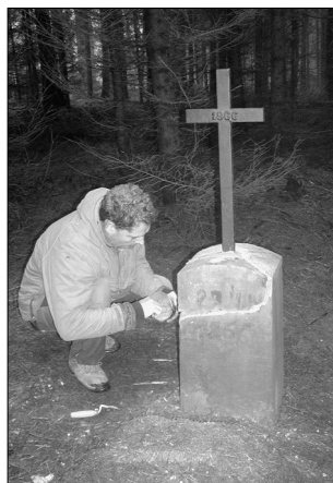
Prasklý kříž u Kacíře

zatím jen svařovaný ocelový kříž stejné velikosti, který zůstal ve skladu materiálu z dřívějších oprav. Čas ukáže, jak dlouho zůstane památka v pořádku. Protože se nedaleko tohoto místa nachází další hrob s původním pomníkem, avšak s nevhodným malým plechovým křížkem, který tam nejspíš připevnili při nějaké opravě v 80. letech 20. stol., rozhodl jsem se pro jeho výměnu. Při demontáži křížku bylo zjištěno, že pomníček byl při předchozí opravě nekvalitně slepen a stejně by brzy opět praskl. Bylo tedy dobře, že k výměně došlo. Právě sem byl osazen onen nalezený ulomený litinový kříž, který je sice o cca 10 cm kratší, ale na pomníčku nevypadá rušivě.