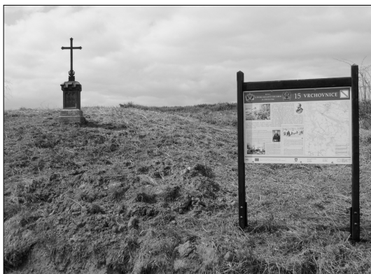
Kříž a zastávka naučné stezky ve Vrchovnici 18. 4. 2015