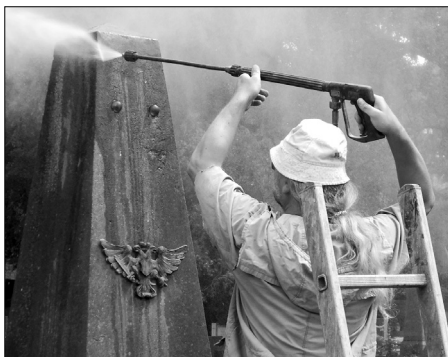
Čištění památky ev. č. 115 v Novém Městě nad Metují tlakovou vodou