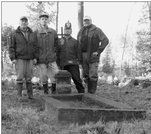
Kříž ev. č. 52 po konečných úpravách 8. 11. 2015