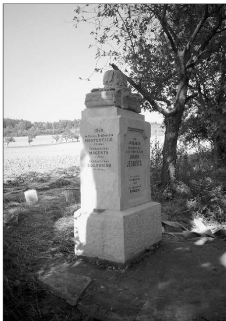
Z průběhu renovace pomníku majora Jesovitse ev. č. 103

Nejvýraznější aktivitou roku byla renovace pomníku ev. č. 103 na hrobě majora J. Jesovitse, která byla financována z rozpočtu krajské dotace pro rok 2020. Pomník byl během zásahu rozebrán a odvezen do dílny restaurátora L. Valeše do Hořic, kde byl celkově zrenovován. Vzápětí byl opětovně sestaven na nově vybetonovaný základ, který zajišťuje dostatečnou stabilitu pomníku ve svahu nad potokem. Oprava byla dokončena začátkem října.