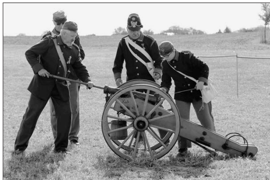
Baterie ViMus u Radimi 19. 9. 2020