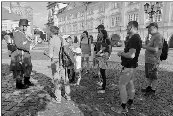
Z vycházek v Jičíně

rok v naší republice. Některé akce byly propagovány pouze prostřednictvím internetu, protože se nedostaly na plakáty vylepené po městě. Tyto vycházky jsou stále vyhledávány obyvateli Jičína i jeho širokého okolí, přičemž většinu z nich toto téma tak zaujme, že si přejí absolvovat delší variantu trasy. Zájemcům bylo prezentováno nové vybavení, jako vytěrák a vrták na kule. V závěru akce pak byly rozdávány letáky zaměřené na jičínské bojiště.