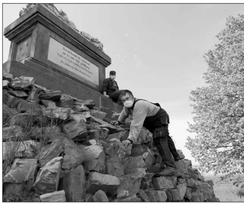
Tovačov, likvidace trávy na centrální mohyle 8. 5. 2020