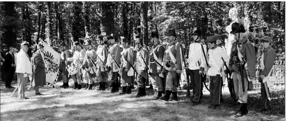
18. pěší pluk v lese Svítb 4. 7. 2020