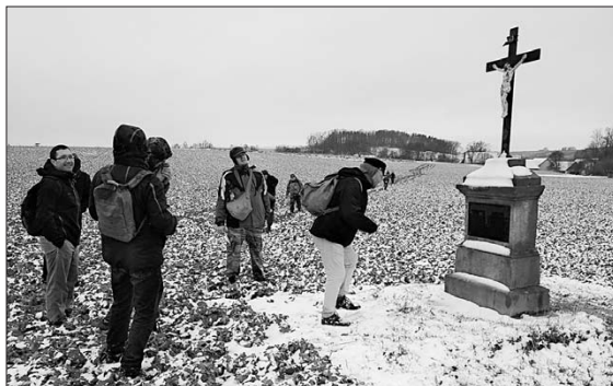
Dílce, spolková exkurze 29. 2. 2020