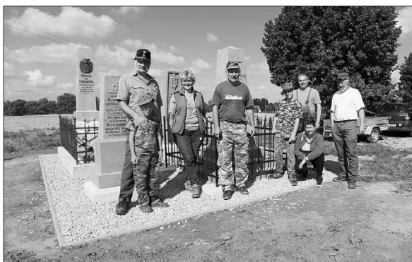
Dlouhé Dvory 6. 9. 2020