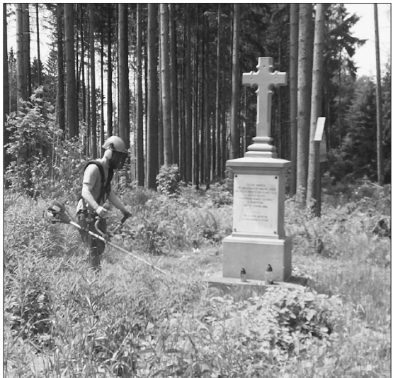
Úprava vegetace u pomníku ev. č. 84