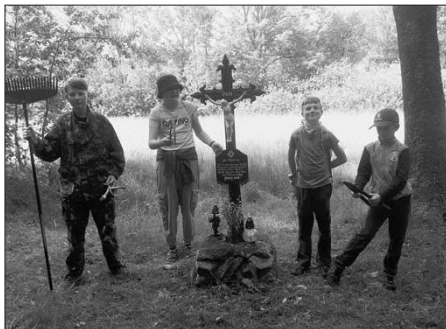
Brigáda u rybníka Vražda 11. 6. 2020

Ve čtvrtek 11. 6. 2020 děti z Historického kroužku Muzea přírody Český ráj a Kadetní setniny jičínského pěšího pluku č. 74. podnikly drobnou brigádu u pomníku na bojišti. Vyrazily do obce Jínolice k rybníku Vražda, kde se nachází kříž na hromadném hrobě rakouských vojáků (ev. č. 25). V okolí památky odstranily suché větve a vyčistily prostor kolem pomníku. Po vylíčení toho, co se v tomto prostoru odehrávalo v době bitvy, následoval výstup zpět do obce Prachov. U pomníku na valu za autobusovou zastávkou (ev. č. 35) děti odhrabaly listí a odstranily větve stínící památce.