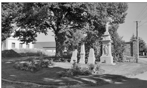
Skupina pomníků na návsi v Benátkách