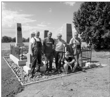
Dlouhé Dvory, po jedné z brigád