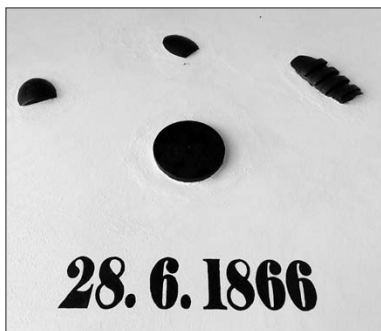
Finální podoba znovu osazených střepin

reakci jsem tyto artefakty stačil zachránit. Po domluvě s pracovníky stavebního odboru mi bylo alespoň umožněno střepiny znovu osadit do stejného prostoru, ovšem zhruba o metr výše, než se původně nacházely. Jejich prvotní místo zaujaly nové elektrorozvodné skříně. Střepiny jsem nejdříve očistil od koroze, zdokumentoval a v identické skladbě zasadil zpátky do stěny vstupního vestibulu. Od okolní omítky jsou odlišené černou barvou a doplněné letopočtem s datem bitvy. V současnosti probíhají stavební práce i ve vnitřních prostorech radnice. Zde se mi však podařilo předejít zničení či ztrátě zbývajících artefaktů, které se uvnitř na stěnách a stropě nacházejí. Bude je však nutné šetrně očistit od omítky a rovněž zvýraznit barvou, což rád zajistím.