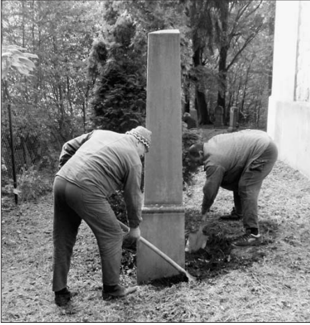
Brigáda u Kbelnice 17. 10. 2020