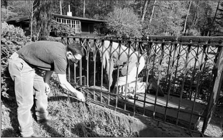
Čištění pomníku v Žehrově ev. č. 3