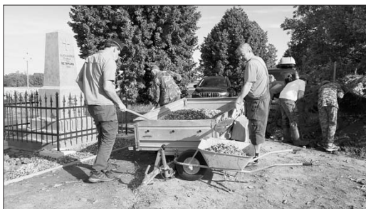
Dlouhé Dvory, úprava okolí pomníků srpen 2020