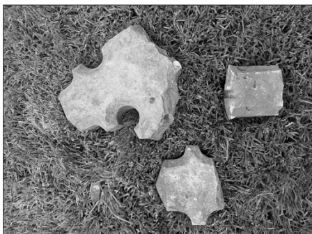
Soubor pískovcových fragmentů z pomníků na bojišti u Náchoda předaný do sbírek Muzea Náchodska