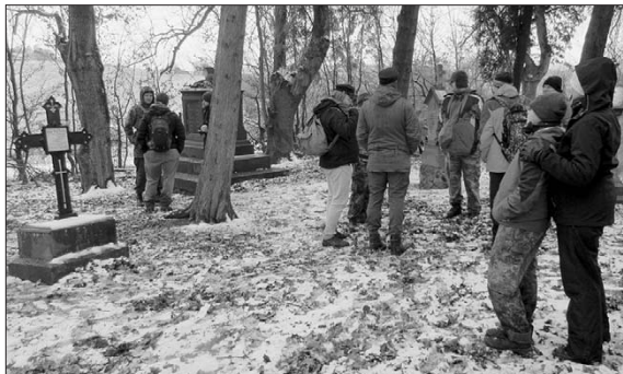
Kbelnice, exkurze 29. 2. 2020