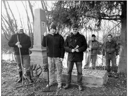
Svijany, brigáda 5. 12. 2020

Brigáda 30. května, zaměřená po celou dobu svého trvání na sekání trávy na ploše bojiště u Mnichova Hradiště, znamenala zviditelnění většiny zdejších pomníků. V této lokalitě byla 15. srpna uskutečněna následná brigáda, která spočívala ve stejné náplni.