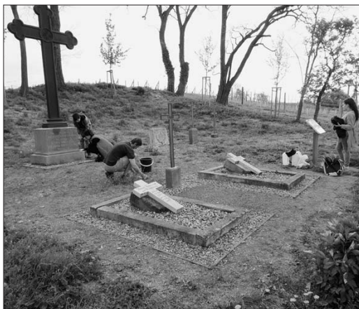
Údržba hřbitova v Mikulově 25. 4. 2020