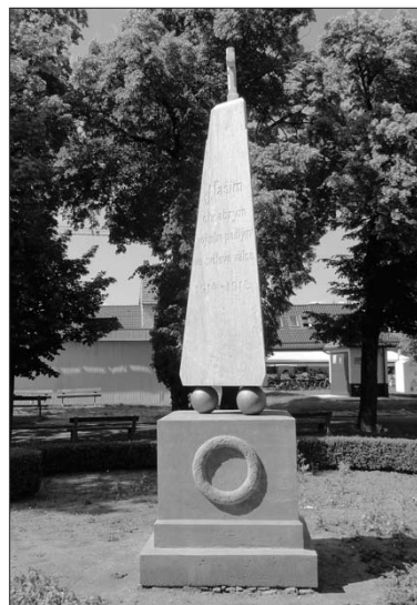
Opravený pomník v Čáslavi