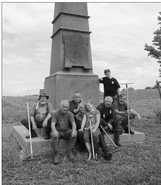
Horní Přímu, sekání trávy u pomníku ev. č. 320