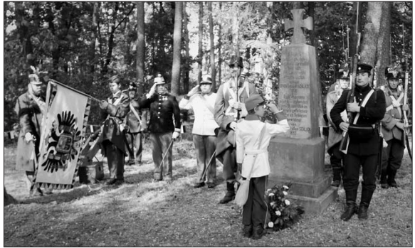
Pieta v Prachově 19. 9. 2020

ní akt, přičemž čestnou stráž u pomníku tvořili vojáci v uniformách 18. pěšího pluku z Hradce Králové, tedy stejné jednotky, ke které podporučík náležel. Po pietním aktu následovala malá bitevní ukáзка a po jejím ukončení starostka obce předala zúčastněným historickým jednotkám pamětní stuhu. Odpoledne probíhalo tradičně ve středu rakouské obranné linie v obci Prachov. U pomníku v Prachovském sedle byl proveden pietní akt k uctění památky vojáků padlých na jičínském bojišti. Připomenuto bylo i několik kamarádů z řad historických jednotek, kteří nás tento rok opustili. Letos jsme si navíc připomněli rovných 130. let od postavení čtyř pomníků v Prachovském sedle, věnovaných vojákům 35. pěšího pluku z Plzně, který bránil Prachovské skály. Tyto pomníky nechal roku 1890 na své náklady