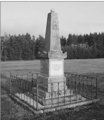
Opravený centrální pomník v Kuřívodách 14. 11. 2020