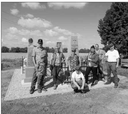
Dlouhé Dvory, brigáda 5. 9. 2020

stále priorávají pole nad pomníkem. Poté jsme se přemístili do Svíbu, kde bylo třeba narovnat, případně znovu zakopat některé sokly s kříži kolem cesty, rozježděné při těžbě dřeva. Původně zamýšlené natírání křížů nebylo možné provést pro vlhké počasí. Při tom byly vysekány náletové dřeviny v okolí památek a upraveno okolí. Před odjezdem byl ošetřen pomník ev. č. 408, 30. praporu pol. myslivců. Další zastávkou byl saský hřbitov v Dolním Přímu. Zde byl vytrhán