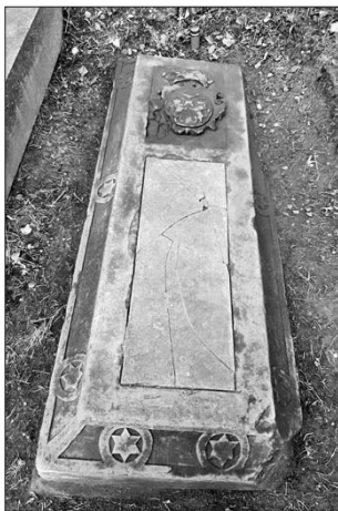
Hrob R. Ottenfelda v Praze po úpravě

1866. Po dohodě s archeology v Litomyšli, a prostřednictvím městského historika, byla tato činnost na obou místech zastavena. Je potěšitelné, že byla městem nabídnuta úprava celého hrobového místa 180 pruských vojáků.