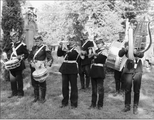
Pruská hudba před kostelem na Chlumu 3. 7. 2020