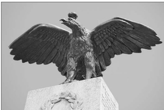
Probluz, nová kopie orlice na pomníku ev. č. 51