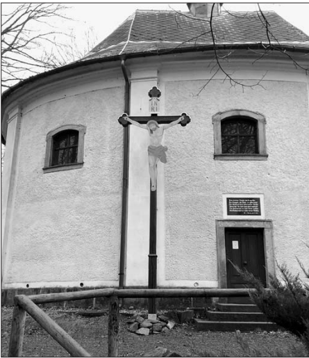
Trutnov, obnovený dřevěný kříž u Janské kaple

Také bylo konečně zakročeno vůči zhoršujícímu se stavu základů u pomníku X. arm. sboru (gen. Gablenze) na Šibeníku. Tento stav trval již delší dobu, ale po poslední zimě došlo k výraznému viditelnému zhoršení. Po demontáži jedné desky opláštění za účelem průzkumu situace byl zjištěn rozpad malty a základového zdiva v úrovni terénu, který způsobil vyvalení pískovcových kvádrů a jejich tlak vůči opláštění. Po proběhlém výběrovém řízení, do kterého se z několika oslovených firem rozhodla zapojit jediná, Kamenictví Novotný z Čermné, byly na podzim zahájeny stavební práce. Základové bloky byly rozebrány a maltové lože pod nimi nahrazeno armovaným betonovým pasem. Poté mohli dojít k opětovnému osazení kamenů a po zatvrdnutí malty i k montáži desek opláštění na své místo. Celá záležitost byla důsledkem povrchní opravy z 90. let 20. stol. Je otázkou, zda nebude v budoucnu nutné provést stejnou operaci i na ostatních stranách základu.