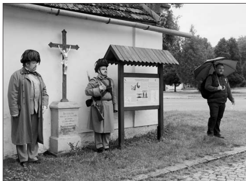
Vycházka u Tovačova 18. 7. 2020