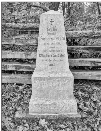
Hoříněves, opravený pomník ev. č. 218