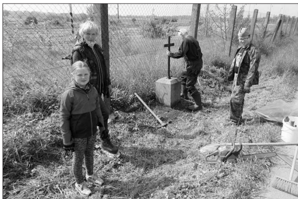
Úprava okolí kříže u Zderaze ev. č. 323