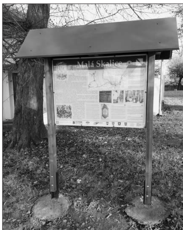
Jeden z nových stojanů naučné stezky u kostela v Malé Skalici (, 20. 11. 2020)