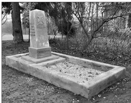
Pomník v Roudnici nad Labem