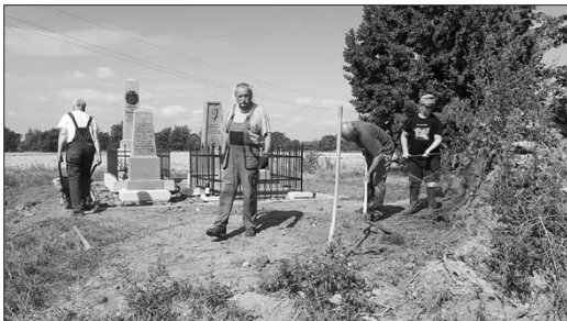
Dlouhé Dvory, brigáda 23. 8. 2020