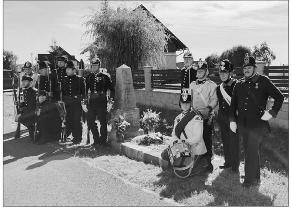
Březina 1. 8. 2020