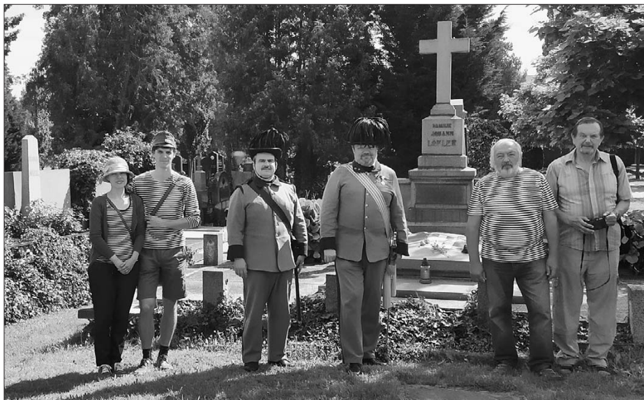
Pieta u hrobů admirálů v Olomouci 25. 7. 2020