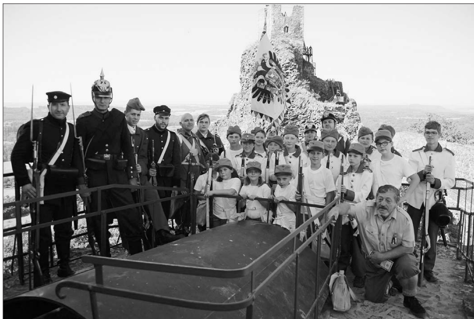
Historické soustředění 1866, Trosky 21. 8. 2020