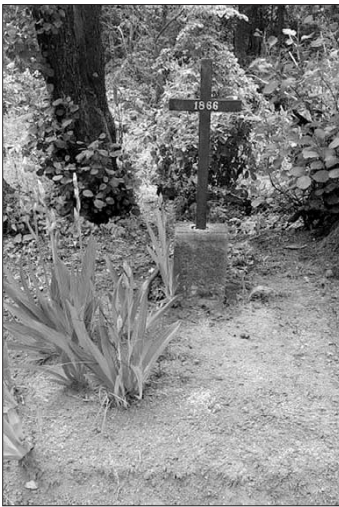
Jarní úprava rovu u jednoho z křížů v Zádolí

Brigády na bojišti byly provedeny individuálně členy SPVH-Náchod a Komitétu 1866 v jarním i podzimním termínu. Dostatek času byl také věnován