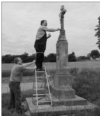
Hydrofobizace kříže u Čechůvek 6. 6. 2020