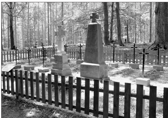
Nové Kocberě, opravený lesní hřbitov