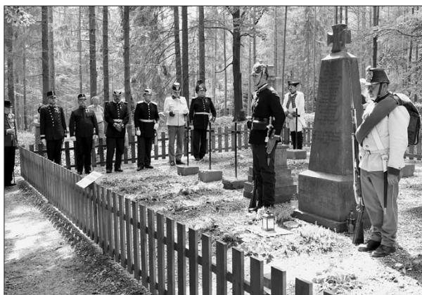
Slavnostní předání opraveného hřbitova v Nových Kocberích veřejnosti

ru kolem hrobů kamei- vem), a spočívaly ve vý- robě a montáži nového dřevěného oplocení hřbi- tova, informační tabule a lavičky. Za příkladně provedenou akci patří spolku Burkersdorf 1745 z.s. velký dík. Ke slavnostnímu odhalení opraveného hřbitova a jeho předání veřejnosti došlo 27. 6. 2020.