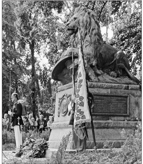
Odhalení pomníku v Krásné Lípě 29. 8. 2020