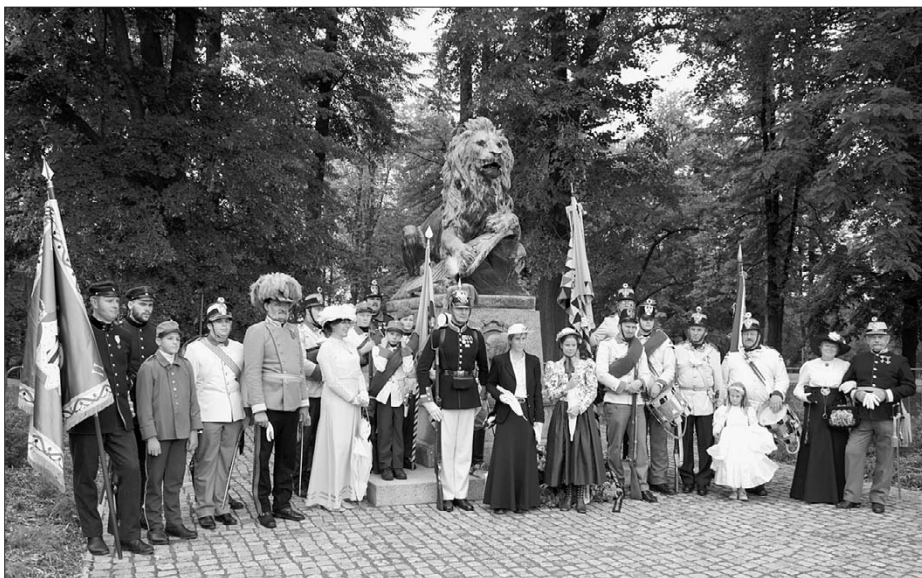
Účastníci odhalení pomníku v Krásné Lípě 29. 8. 2020