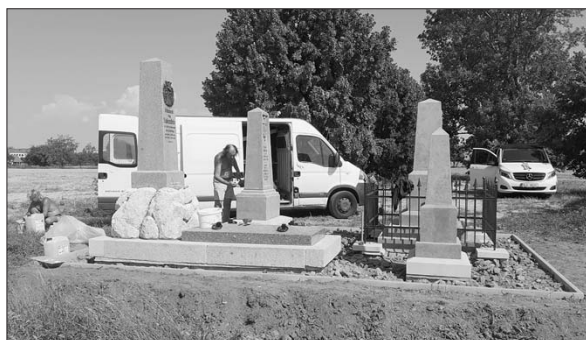
Dlouhé Dvory 11. 8. 2020