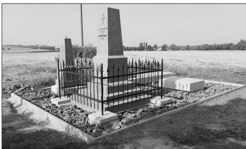
Dlouhé Dvory 10. 8. 2020