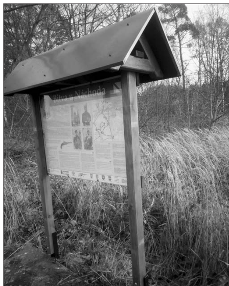
Jeden z nových stojanů naučné stezky Náchod-Vysokov-Václavice 1866