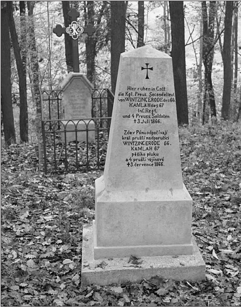
Les Svíb, opravené pomníky ev. č. 140 a 141