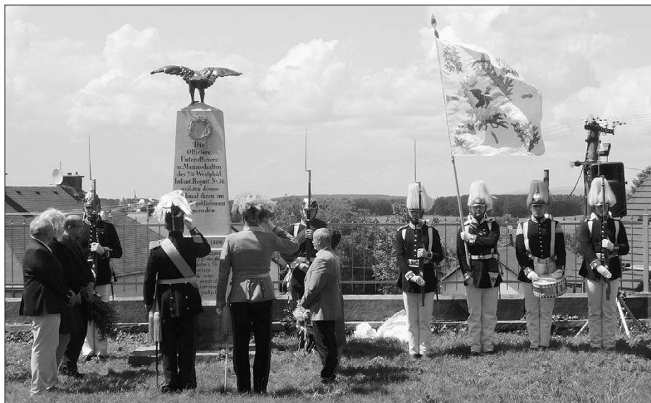
Probluz 3. 7. 2020, odhalení opraveného pomníku