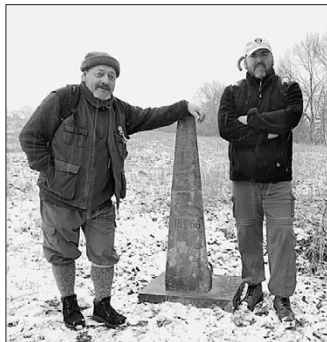
Zámezí, exkurze 29. 2. 2020