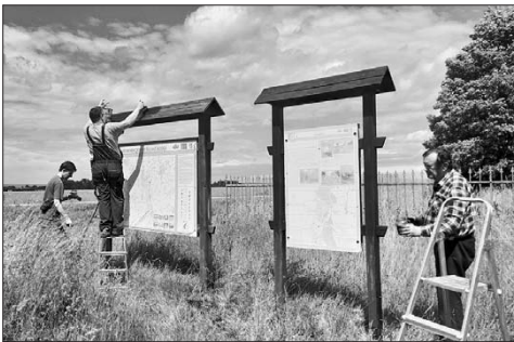
Nátěr stojanů NS Tovačov 6. 6. 2020