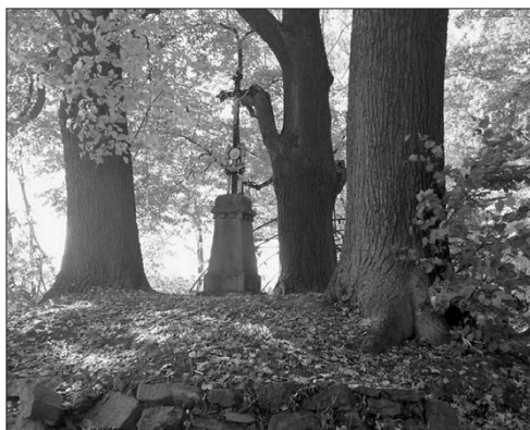
Hromadný hrob v Havlíčkově Brodě – Perknově

Historický klub Záviš zjistil na hřbitově ve Svitavách aktivity, vedoucí ke zřizování nových hrobových míst, které již zasahovaly do dvou hromadných hrobů z roku