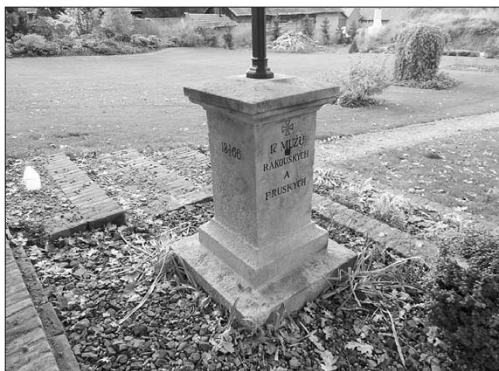
Benátky, opravený sokl kříže ev. č. 306 (foto B. Karešová, listopad 2020)

Na začátku roku, 8. ledna 2020, byla předána kolegou Jiřím Náhlovským do výroby formou pruské orlice, určené pro pomník ev. č. 51 pruského 7. vestfálského pěšího pluku č. 56 na hřbitově v Probluzi.