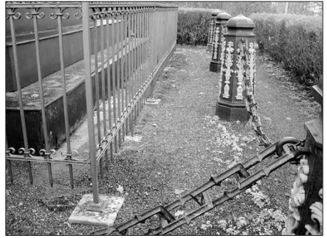
Trutnov, pomník na Šibeníku po opravě