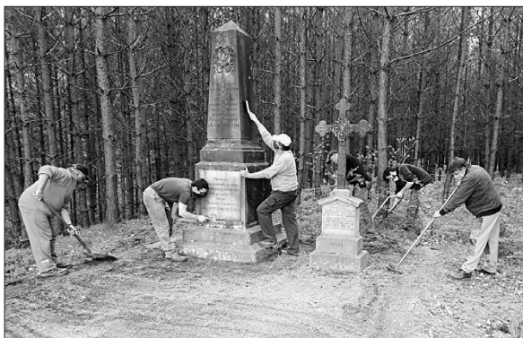
Brigáda u Kosti dne 1. 5. 2020

Omezení pohybu osob a jejich shromažďování v početně stanovených skupinách v jarních měsících v souvislosti s covidem mělo také za následek přesunutí termínu již tradiční brigády, spojené se sběrem odpadků podél silnice E268, procházející bojištěm u Kuřívod, až na 1. května. Od předcházejícího sběru v loňském roce oba příkopy opět „ozdobily“ různorodé a četné odpadky, takže naplnit 18 igelitových pytlů nedalo mnoho námahy. Souběžně se sběrem byl prováděn nátěr stojanu informační pavězy v Plouznici, stojanů informačních tabulí v Mimoni, popisující události v letech 1866, 1914-1918, a v Kuřívodech u kostela sv. Havla. Zvelebením prošly v uvedený den rovněž některé pomníky na bojišti u Mnichova Hradiště. Větší zásah po zimním a jarním období byl proveden u Žehrova