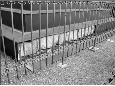
Trutnov, stav základů pomníku na Šibeníku před opravou