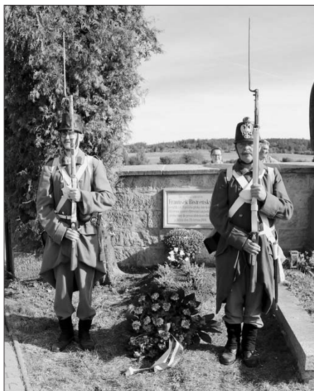
Pietní akt v Radimi 19. 9. 2020