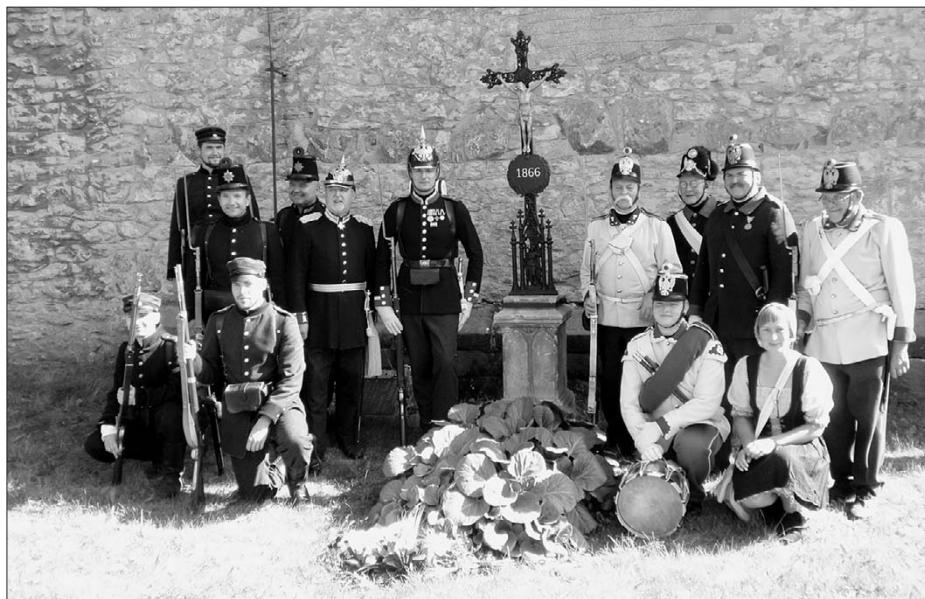
Pieta u kostela sv. Vavřince v Březině

vojákům u pomníku ev. č. 55. Rovněž proběhla návštěva hřbitova u kostela sv. Vavřince a zde byla uctěna památka 6 pruských vojáků.