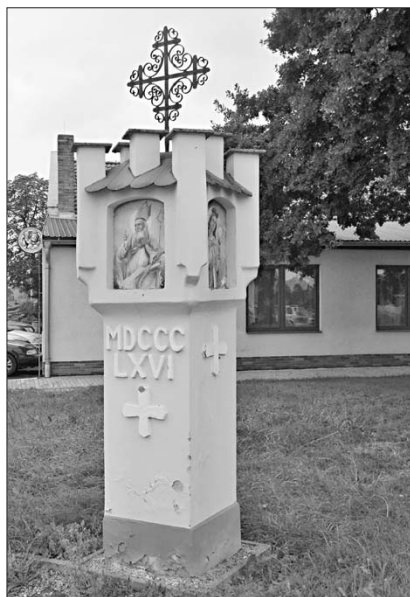
Zděná boží muka v Pištině

Během návštěvy Jižních Čech navštívil a zdokumentoval J. Jemelka většinu památek, které se v tom kraji nachází. Konkrétně šlo o památky v Chudenicích (OC 149), Kovářově (OC 205), Sedlčanech (OC 207), Štětkovicích (OC 118), Pištině (OC 204) a Údraži (OC 151). Jedná se vesměs o votivní památky. Zděná boží muka v Pištině byla do té doby pro Komitét 1866 neznámá.